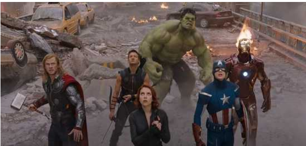
Plongée Avengers 2011 - Joss Whedon