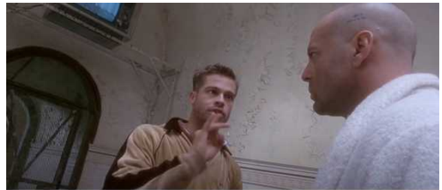
Plan débullé (Dutch Angle) L'Armée des douze singes 1994 Terry Gillian