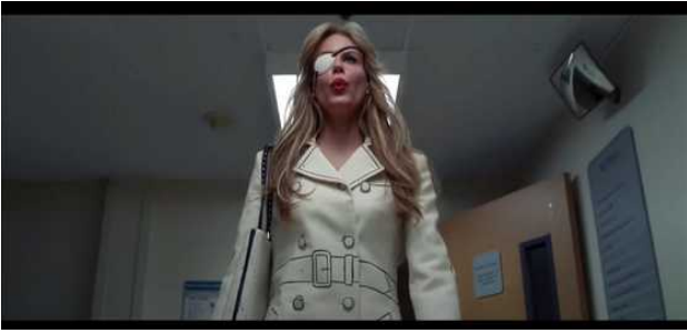
Contre plongée Kill Bill Vol1 2003 . Quentin Tarantino

Angles de vue et point de vue. - Renseigne et guide le spectateur sur l'état d'esprit du personnage, pointe un élément signifiant, exprime l'intention dramatique du réalisateur