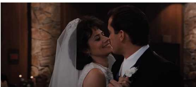
Hauteur épaule Les affranchis 1990 Scorsese