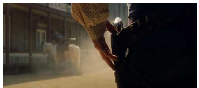
Hauteur hanche Once upon a time in Hollywood 2013 Quentin Tarantino