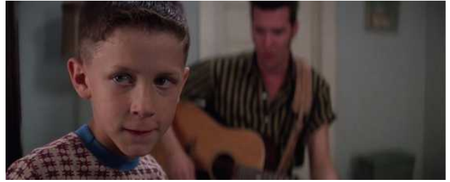
Hauteur yeux Forest Gump Robert Zemeckis 1994