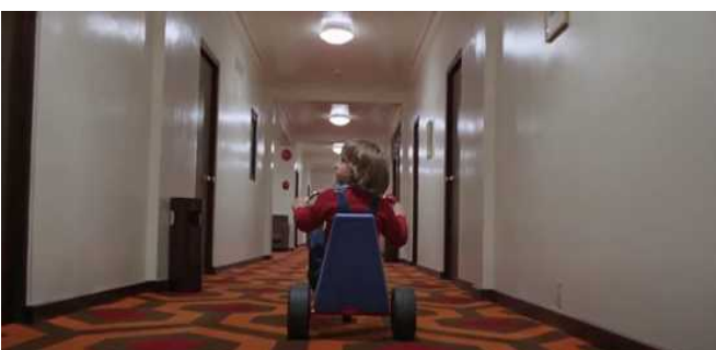
Hauteur sol The Shining Stanley Kubrick 1980