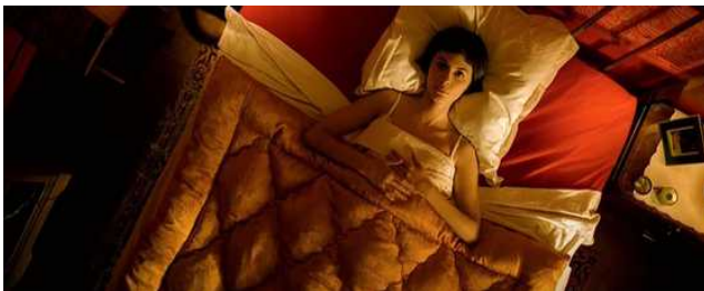
Overhead à 90° Amélie Poulain Jean-Pierre Jeunet - 2001