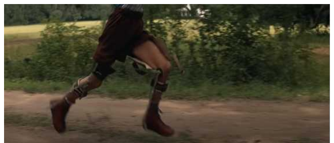
Hauteur genou Forest Gump Robert Zemeckis 1994