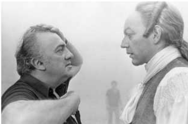
Federico Fellini et Donald Sutherland sur le tournage du Casanova de Fellini, 1976.