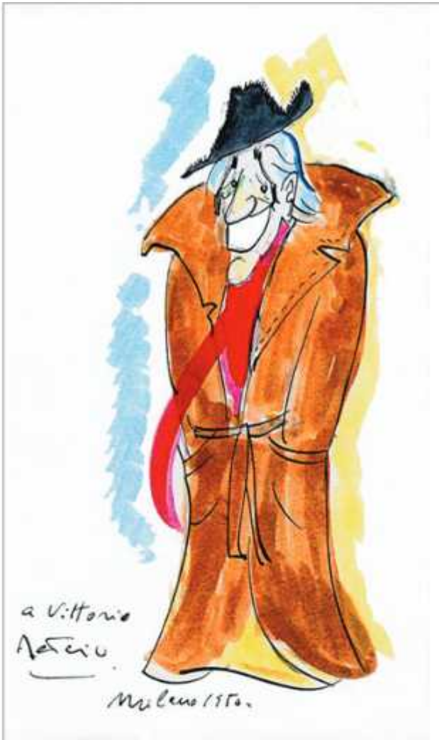
Vittorio De Sica, dessin de Federico Fellini, 1950. © Adagp, Paris 2022. Source du dessin : Museo Fellini, Rimini.