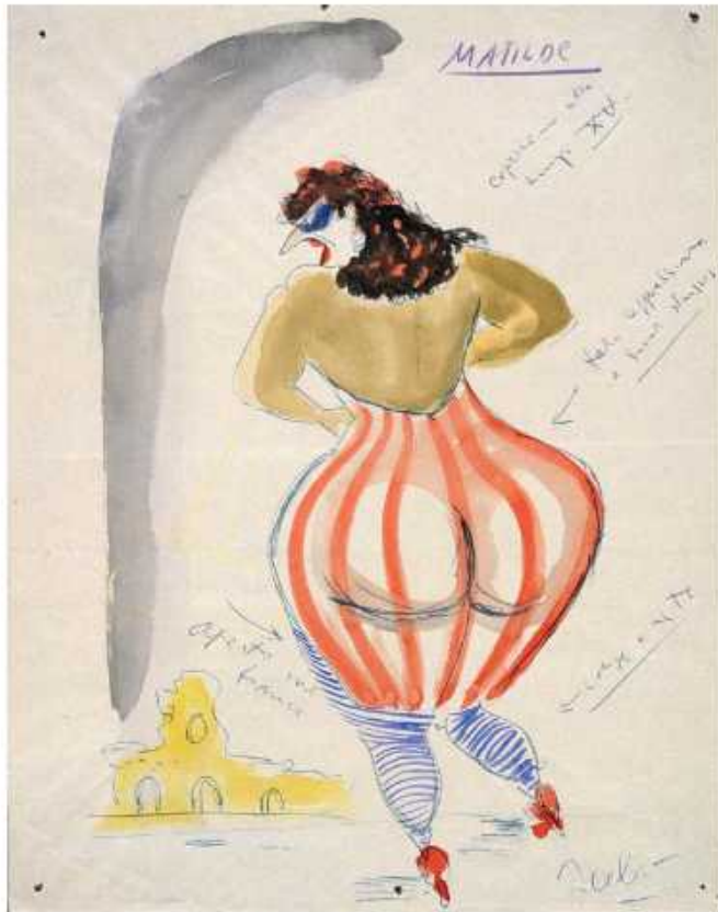
Federico Fellini. Maquette du costume de Matilda pour son film Les Nuits de Cabiria , 1957 Aquarelle et stylo-bille sur papier, 52,6 x 42,6 cm Collection La Cinémathèque française © ADAGP