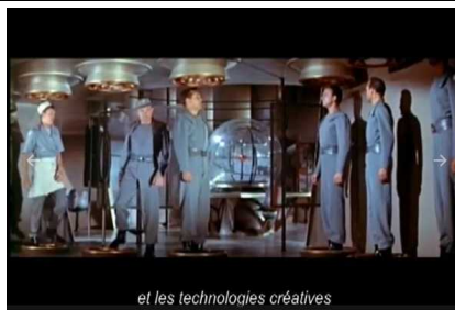
et les technologies créatives