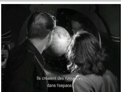
Ils créaient des romances dans l'espace.