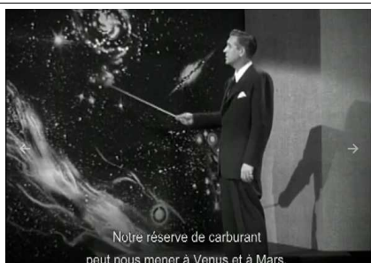
Notre réserve de carburant peut nous mener à Venus et à Mars.