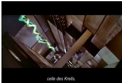
celle des Krells.