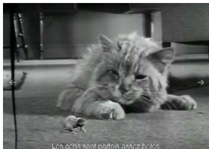
Les chats sont parfois assez hâtes.