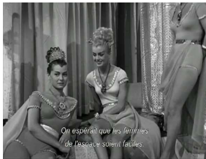
On espérait que les femmes de l'espace soient faciles.