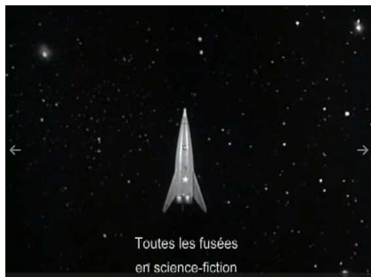
Toutes les fusées en science-fiction