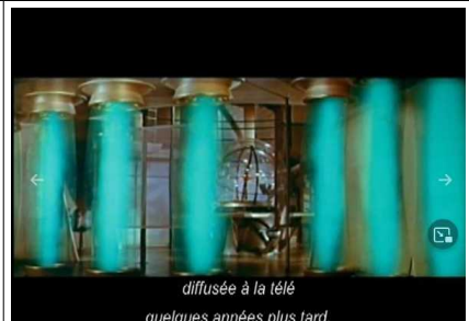
diffusée à la télé quelques années plus tard.