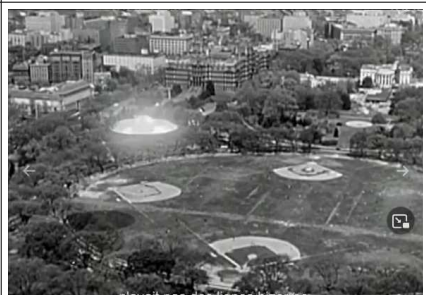
n'avait pas des lignes bizarres