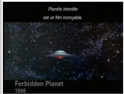
Forbidden Planet 1956