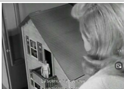
La science n'a pas créé un monstre.