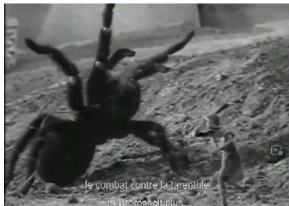
le combat contre la tarantule n'a cessé plus.