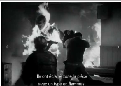
Ils ont éclairé toute la pièce avec un type en flammes.