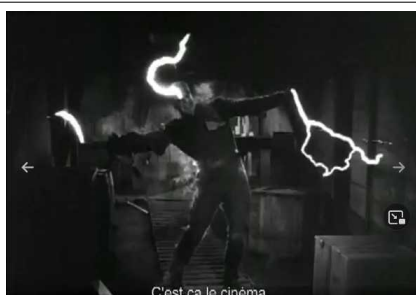
C'est ça le cinéma.