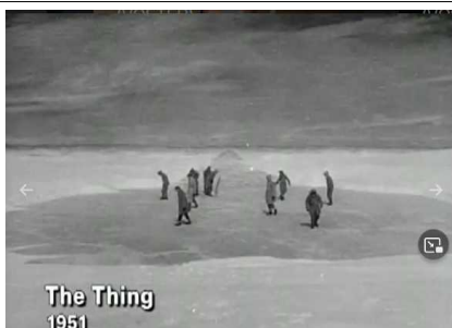
The Thing 1951