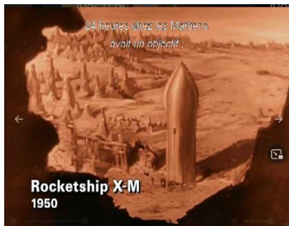
Rocketship X-M 1950