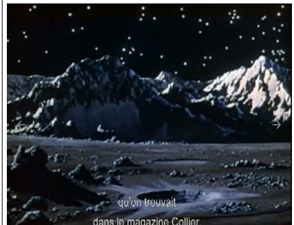
qu'on trouvait dans le magazine Collier.