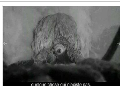
quelque chose qui n'existe pas.