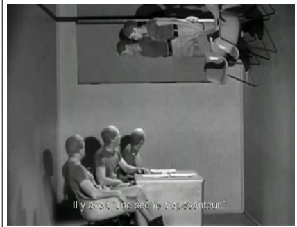
Il y avait une soixante d'espérance.