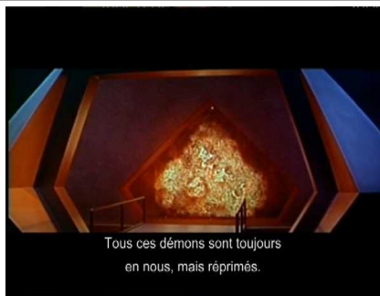
Tous ces démons sont toujours en nous, mais réprimés.