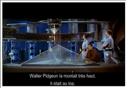
Walter Pidgeon la montait très haut. Il était au top.