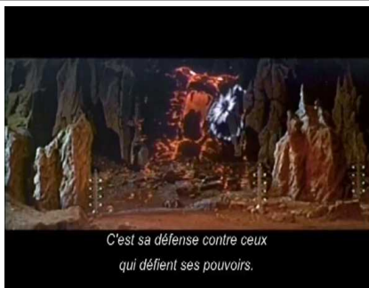
C'est sa défense contre ceux qui défient ses pouvoirs.