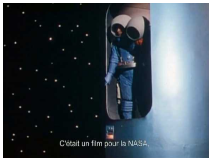
C'était un film pour la NASA.