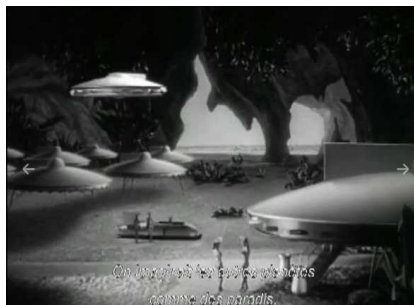
On trouvait les choses étranges comme des objets