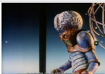
Le monde des extraterrestres