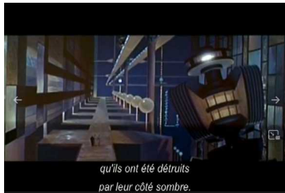
qu'ils ont été détruits par leur côté sombre.