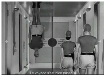
Le voyage s'est bien passé.