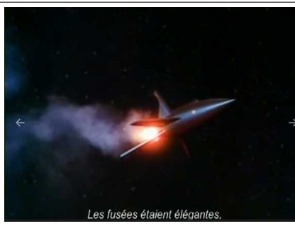
Les fusées étaient élégantes.