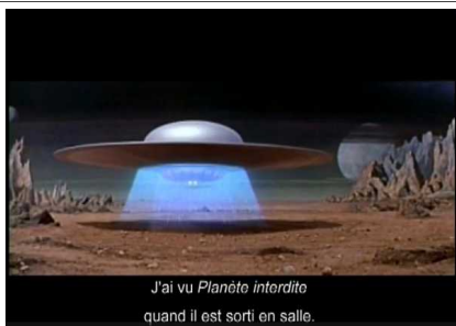
J'ai vu Planète interdite quand il est sorti en salle.