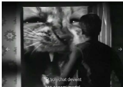
Et son chat devient son ennemi mortel.