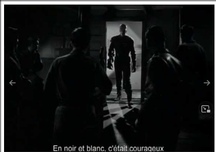
En noir et blanc, c'était courageux