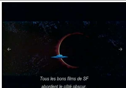
Tous les bons films de SF abordent le côté obscur.