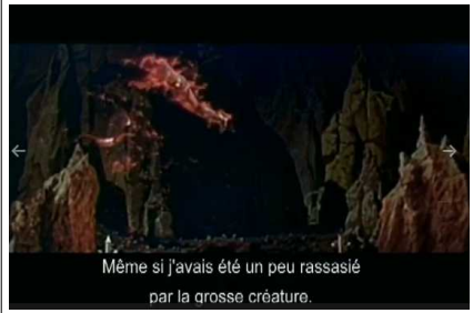
Même si j'avais été un peu rassasié par la grosse créature.