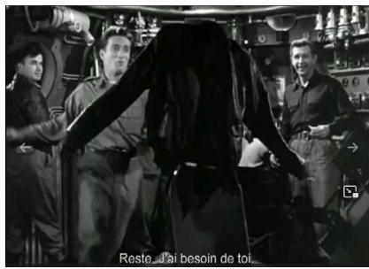
Reste, j'ai besoin de toi.