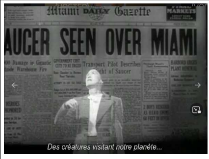
Des créatures visitant notre planète...