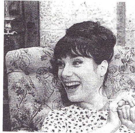
L'eau à la bouche, de Jacques Doniol-Valcroze

Les producteurs sont d'abord payés de leur audace : Les quatre cents coups font 450 000 entrées, Les cousins 416 000 et A bout de souffle 380 000. Beaucoup d'autres, entre 200 000 et 300 000 entrées, se révèlent aussi de bonnes affaires. La réussite commerciale dure trois ans et se double d'un beau succès critique. Animés par la revue Positif ,