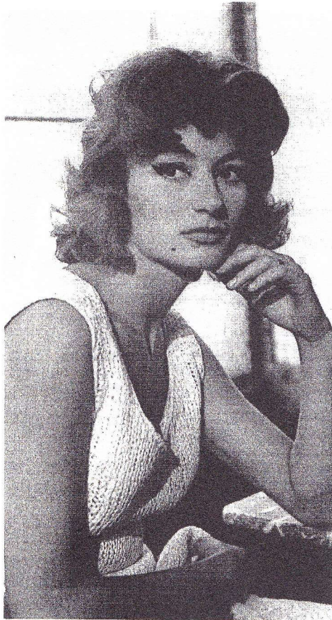
Lola, de Jacques Demy