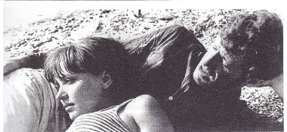
Pierrot le fou , de Jean-Luc Godard

Mais cette attente n'aurait probablement pas débouché sur des réalisations concrètes si les critiques-cinéastes n'avaient pu contourner pratiquement l'obstacle technologique, financier et institutionnel constitué par les règles et les coutumes du milieu professionnel. Heureusement Claude Chabrol tourne en dehors de toute réglementation en décembre