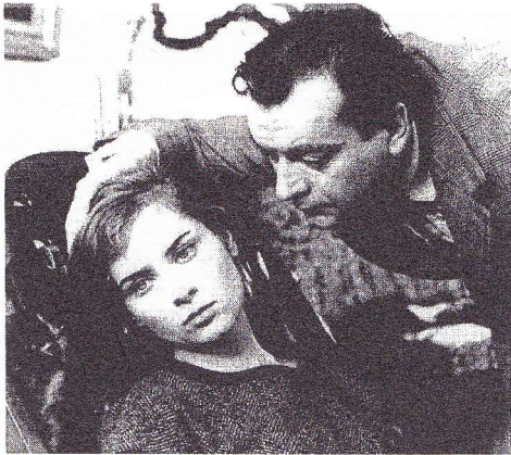
Les cousins , de Claude Chabrol

1957-janvier 1958 Le beau Serge grâce à un héritage de son épouse et il obtient une prime à la qualité du CNC de 35 millions de francs d'alors qui rembourse quasiment le film avant même sa distribution commerciale ! Il recommence aussitôt avec Les cousins et aide de même Éric Rohmer et Jacques Rivette à entreprendre Le signe du lion et Paris nous appartient . C'est alors que les producteurs, alléchés par l'arithmétique simpliste de budgets très faibles (quarante à cinquante millions de francs) assortis de promesses de doubles bénéfices (dans les salles et par la prime à la qualité), se lancent au secours de la victoire en fournissant à des jeunes les moyens — limités — nécessaires à tourner leur premier long métrage, soit qu'ils aient derrière eux une sécurisante carrière de court-métragistes (Franju ou Resnais), soit qu'ils présentent le même « profil » que Chabrol et Truffaut qui viennent de réussir (Godard, Demy, Kast, Doniol-Valcroze...). C'est parce que les films Nouvelle Vague coûtent beaucoup moins cher que ceux des Clouzot, Clair, Clément ou Delannoy que le mouvement peut se développer et les nouveaux réalisateurs remplacer les anciens : seule la réussite économique rend possible la mutation esthétique.