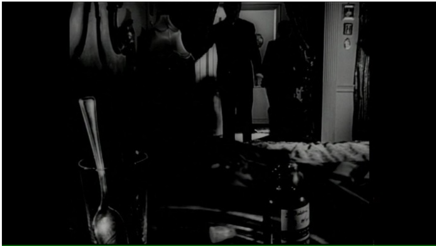
Citizen Kane 1946 Orson Welles