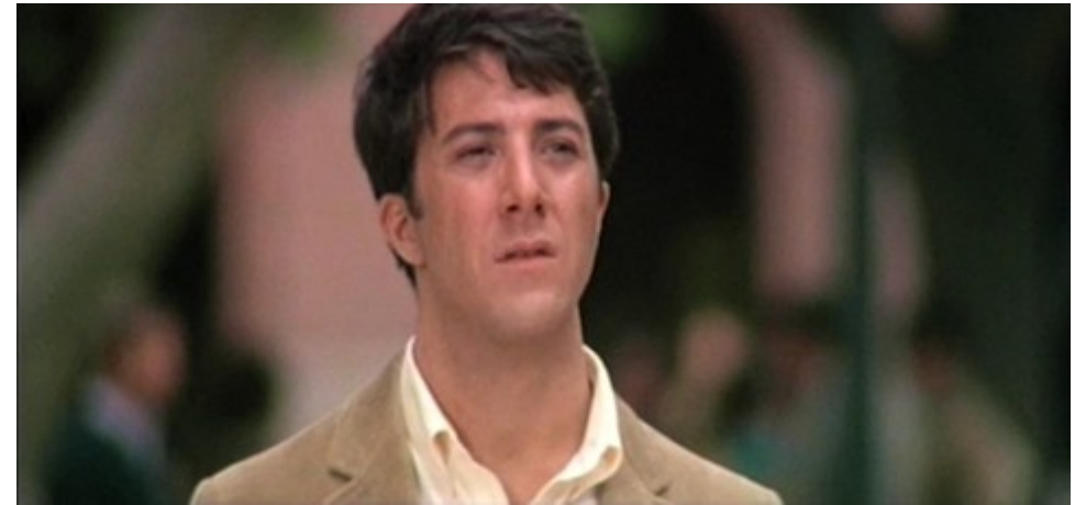
Photogrammes tirés de The Graduate (1967) de Mike Nichols