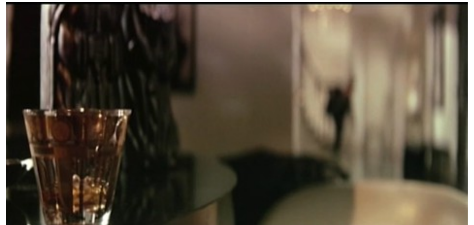
The Graduate (1967) de Mike Nichols