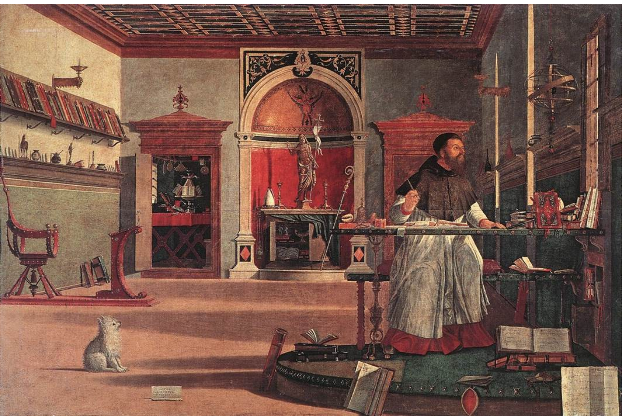
Vittore Carpaccio, La Vision de Saint Augustin , Scuola di San Giorgio degli Schiavoni, Venise, 1502

http://www.jeandytar.com/notes-vision-bacchus/construire-espace-carpaccio/ La vision d'un dessinateur BD Jean Dytar