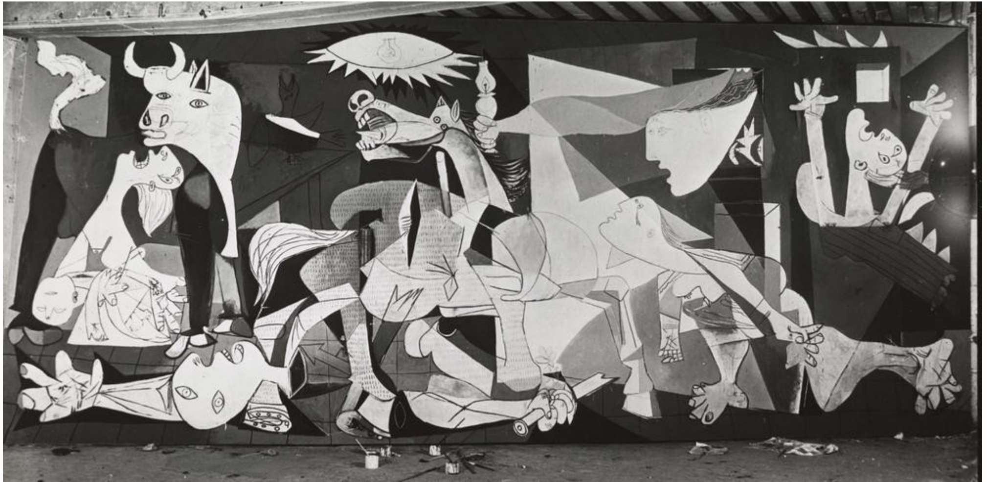
Guernica Picasso 1937 Museo Reina Sofia