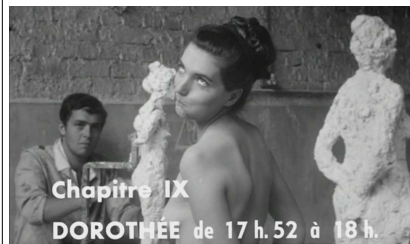
Qu'elle est gentille, qu'elle est belle