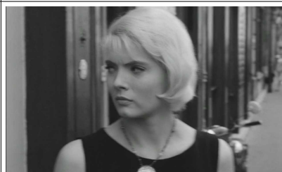
Faire le lien de cette sortie depuis le miroir brisé avec la sortie Cléo de chez la