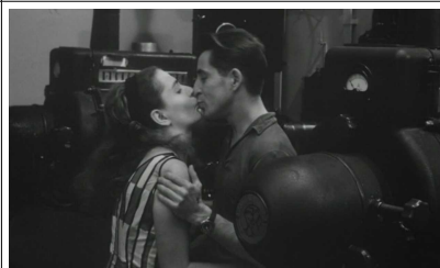
Voilà ma poupée .... D'amour ...