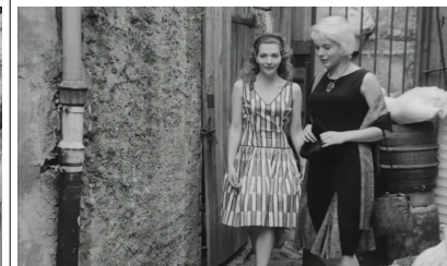
Vraiment ça ne te gêne pas de poser