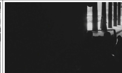
Je suis malade .. c'est grave .. mortel ou quelque chose comme ça .. oh quelle horreur c'est pas possible ..