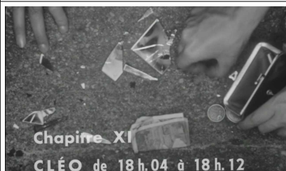
C'est un signe de mort c'est horrible ... il ne faut pas croire des choses pareilles casser un miroir