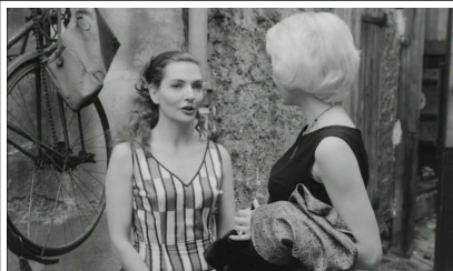
Peur d'un défaut ... Moi je suis heureuse de mon corps pas orgueilleuse