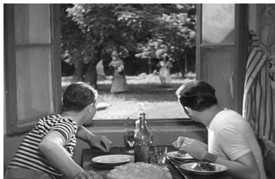
Partie de Campagne Jean Renoir