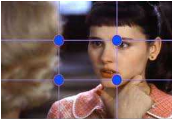
Huit femmes F.Ozon