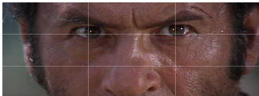
Il était une fois dans l'ouest Sergio Leone