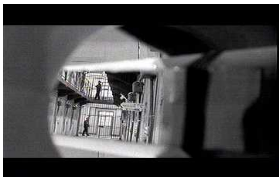
Le trou Jacques Becker

Le surcadrage c'est créer un cadre dans le cadre qui resserre le plan à la manière d'une focale longue resserre l'action sur un élément et qui peut prendre différentes significations selon le plan.