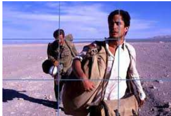
Carnets de voyage Walter Salles