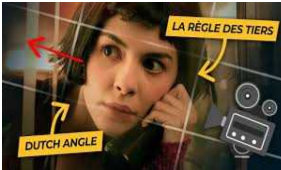
Amélie Poulain Jeunet