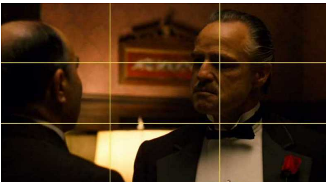
Le Parrain F.F Coppola