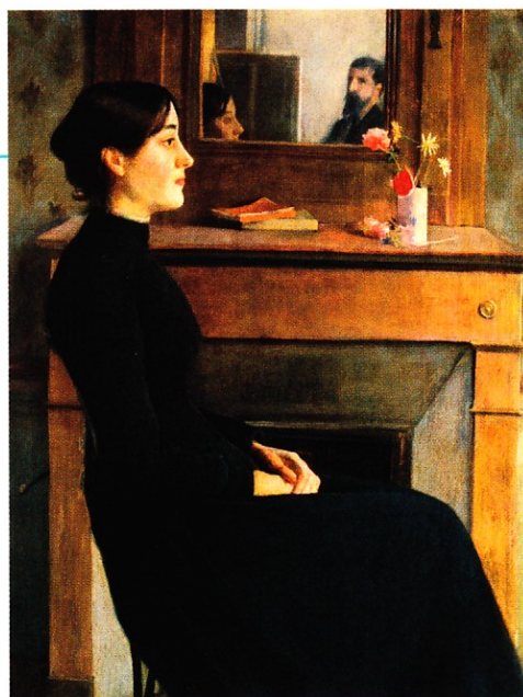
Santiago Rusiñol, Figura femenina , 1894. Museu Nacional d'Art de Catalunya, 100 x 81 cm