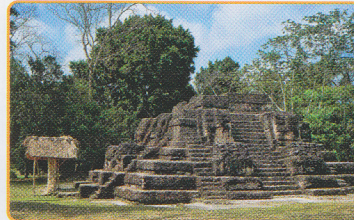
Observatorio astronómico Uaxactún, Guatemala