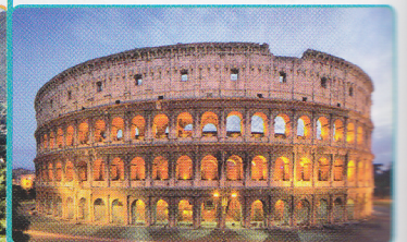
Coliseo Roma, Italia