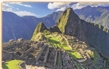
Machu Picchu Perú