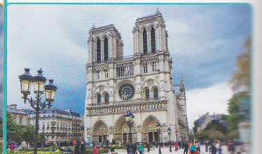
Catedral de Notre Dame París, Francia