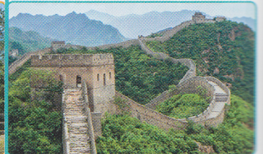
Gran Muralla China China