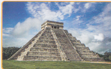
Zona arqueológica de Chichén Itzá Yucatán, México