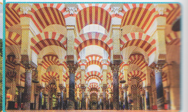
Mezquita de Córdoba España