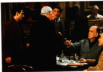
Adaptación al cine de La colmena por Mario Camus (1982): los clientes del café que tanto odiaba Rosa.

*Isaac Peral (1851-1895), ingeniero y marino español, inventor de un submarino eléctrico que revolucionó la navegación subacuática.