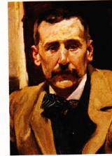
Benito Pérez Galdós (1843-1920)

Novelista y dramaturgo español, uno de los escritores más representativos del siglo XIX. En Episodios nacionales , Galdós interpreta la historia de España del siglo XIX. Escribió novelas de tesis que abordan problemas religiosos, sociales o políticos. Sus obras maestras son una serie de novelas realistas en las que retrata a la sociedad madrileña, entre las que destaca Fortunata y Jacinta (1887).