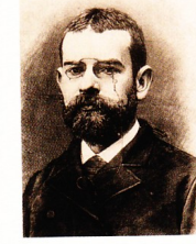
Leopoldo Alas (1852-1901)

Novelista y dramaturgo español, uno de los escritores más representativos del siglo XIX. En Episodios nacionales , Galdós interpreta la historia de España del siglo XIX. Escribió novelas de tesis que abordan problemas religiosos, sociales o políticos. Sus obras maestras son una serie de novelas realistas en las que retrata a la sociedad madrileña, entre las que destaca Fortunata y Jacinta (1887).