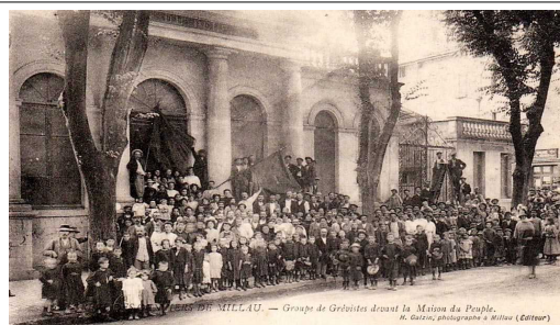
GRÈVE DES GANTIERS DE MILLAU. — Groupe de Gréboites devant la Maison du Peuple.