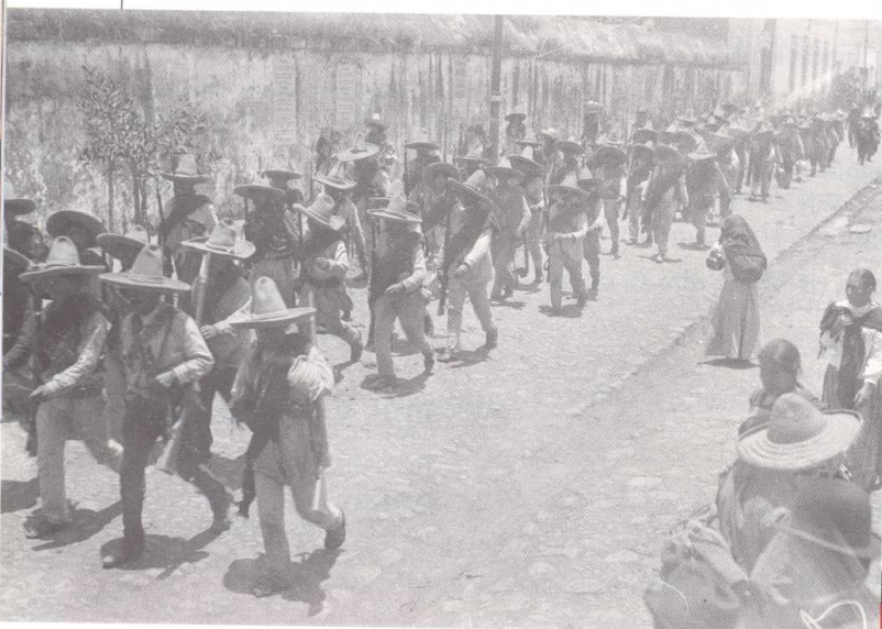
3 Zapatistas en marcha hacia Xochimilco, 1914.

El desarrollo del país se hace gracias a las compañías extranjeras: construcción de fábricas, de ferrocarriles, modernización de los puertos, urbanización de las grandes ciudades. La dependencia del país respecto al extranjero suscita el descontento de una parte de la población mexicana, sobre todo de los campesinos, que se quedan al margen de la modernización. La propiedad de la tierra está en manos de algunas familias, dueñas de grandes latifundios, cuando la inmensa mayoría no tiene lo necesario para vivir.