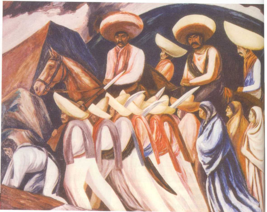
Zapatistas, José Clemente Orozco, 1931. Nueva York, MOMA.

Entre 1910 y 1920, México fue sacudido por una serie de revueltas que corresponden a lo que se llama Revolución mexicana, caracterizada por su aspecto rural, sin modelos ni ideología que la respalde. Encabezada por Pancho Villa y Emiliano Zapata, provocó la caída del dictador Porfirio Díaz. La expresión artística de la Revolución es el muralismo. > p. 201