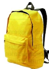
(lo) zaino ♂