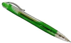
(la) penna ♀