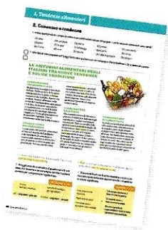
(la) pagina ♀