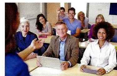
(la) lezione ♀