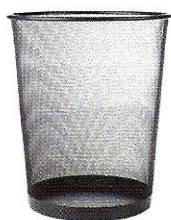
(il) cestino ♂