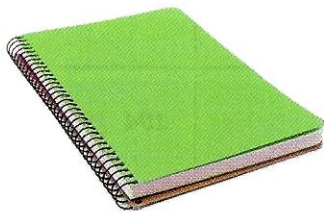
(il) quaderno ♂