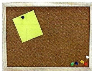
(la) bacheca ♀