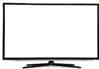
(lo) schermo ♂