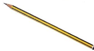
(la) matita ♀