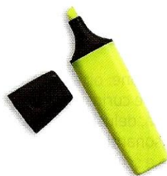
(l') evidenziatore ♂