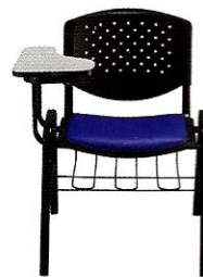
(la) sedia ♀