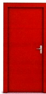
(la) porta ♀