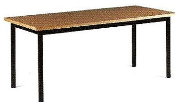
(il) tavolo ♂