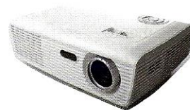
(il) proiettore ♂