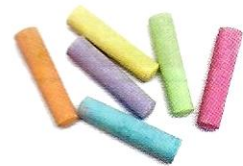
(il) gesso ♂