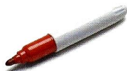
(il) pennarello ♂