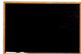
(la) lavagna ♀