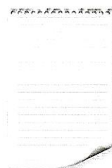
(il) foglio (di carta) ♂