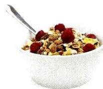
i cereali [tchéreali] les céréales