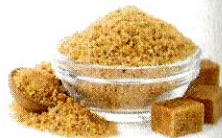
lo zucchero [dzoukkéro] le sucre

Demandez un ristretto pour avoir un café serré ; un caffè lungo pour un café allongé. Un macchiato, c'est un café noisette.