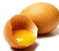
l'uovo [ouovo] l'œuf

le jaune est il rosso, le blanc, l'albumine