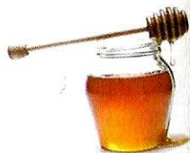
il miele [miélé] le miel