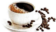
il caffè [caffè] le café

Demandez un ristretto pour avoir un café serré ; un caffè lungo pour un café allongé. Un macchiato, c'est un café noisette.