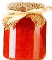
la marmellata [marméllata] la confiture

la marmellata di albicocche la confiture d'abricot