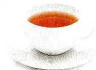
il tè [tè] le thé

« Sans sucre » se dit senza zucchero ou amaro.