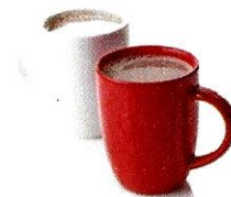
la cioccolata calda [tchocolata calda] le chocolat chaud

Dans certaines régions, on dit aussi la brioche ou la brioscia. Elle peut être nature ou fourrée à la crème, à la confiture ou au chocolat.