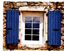
le imposte [ime-pasté] les volets

Les volets roulants s'appellent, en revanche, le tapparelle.