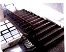
il pianerottolo [pianérotto] le palier

Le voci di corridoio, ce sont les bruits de couloir.