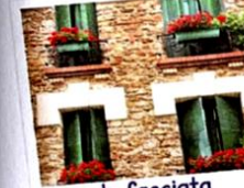
la facciata [fatchata] la façade