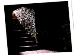
la cantina [cane-tina] la cave

...ou « le bar à vins » « La cantine » se dit la mensa.