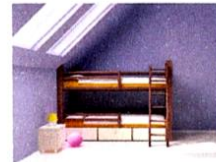
la soffitta [soffitta] le grenier

...ou « le bar à vins » « La cantine » se dit la mensa.