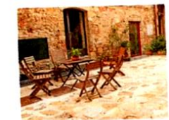
il cortile [cortilé] la cour