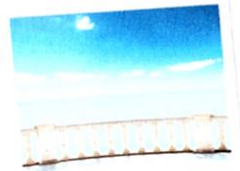
la terrazza [tèrrata] la terrasse

Ceci est le balcon le plus connu d'Italie, celui de Juliette, il balcone di Giulietta, à Vérone.