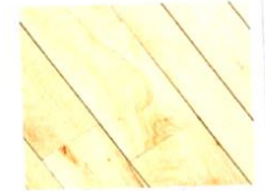
il pavimento [pavimé-to] le plancher

Una piastrella, c'est un seul carreau (du sol ou du mur).