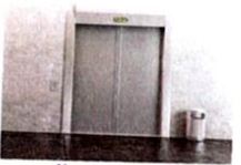
l'ascensore [achène-soré] l'ascenseur

L'escalator se dit la scala mobile. Et la marche, c'est lo scalino.