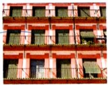
il piano [piano] l'étage