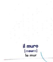
il muro [mouro] le mur

au pluriel : i muri Attention, le mura c'est les remparts !