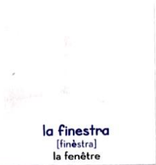
la finestra [finèstra] la fenêtre

Les volets roulants s'appellent, en revanche, le tapparelle.