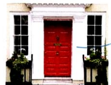
la porta [porta] la porte