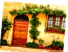
il pianterreno [piane-tèrréno] le rez-de-chaussée