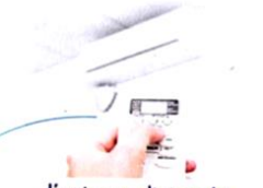
l'aria condizionata [aria cone-ditionata] la clim

Le « radiateur » se dit il calorifero ou il termosifone.