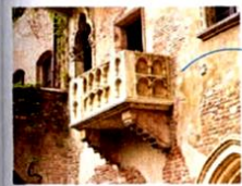
il balcone [balconé] le balcon

Ceci est le balcon le plus connu d'Italie, celui de Juliette, il balcone di Giulietta, à Vérone.