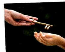
la chiave [kiavé] la clé