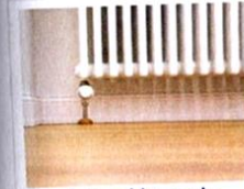
il riscaldamento [riscaldamé-to] le chauffage

Le « radiateur » se dit il calorifero ou il termosifone.