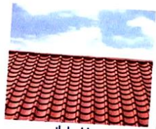
il tetto [tétto] le toit

Un senzatetto est une personne sans domicile fixe.