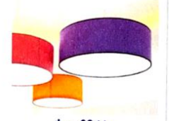
il soffitto [soffitto] le plafond

au pluriel : i muri Attention, le mura c'est les remparts !