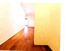
il corridoio [corridoio] le couloir

Le voci di corridoio, ce sont les bruits de couloir.