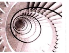
la scala [scala] l'escalier

L'escalator se dit la scala mobile. Et la marche, c'est lo scalino.