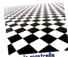
le piastrelle [piastrellé] le carrelage

Una piastrella, c'est un seul carreau (du sol ou du mur).