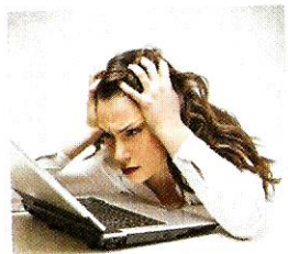
Sono stressato. [sono stréssato] Je suis stressé.

...ou mi sento bene. Si vous n'allez pas bien, dites non sto bene ou sto male.