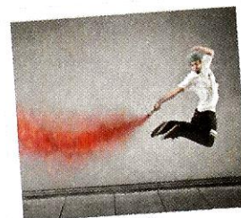
Sono in forma. [sono ine forma] J'ai la pêche.

essere stanco morto être mort de fatigue