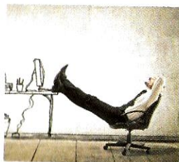
Sto bene. [sto bené] Je suis bien.

...ou mi sento bene. Si vous n'allez pas bien, dites non sto bene ou sto male.