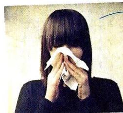
Sono malato. [sono malato] Je suis malade.