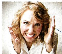
Sono furioso. [sono fouriozo] Je suis furieux.

andare su tutte le furie entrer dans une humeur noire