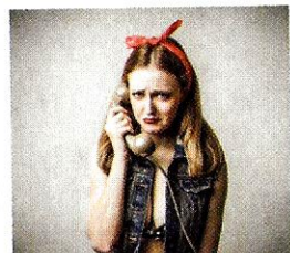
Sono triste. [sono tristé] Je suis triste.

Si vous êtes très heureux, vous pouvez dire Sono felicissimo.