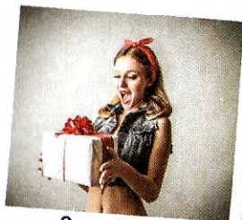
Sono felice. [sono felicità] Je suis heureux.

Si vous êtes très heureux, vous pouvez dire Sono felicissimo.