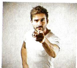
Sono arrabbiato. [sono arrabbiato] Je suis en colère.

En mangeant gli spaghetti all'arrabbiata, on devient tout rouge, tellement cest épicé !