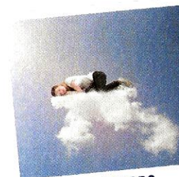
Sono sereno. [sono séréno] Je suis serein.

On pourrait dire aussi : sono in pensiero.