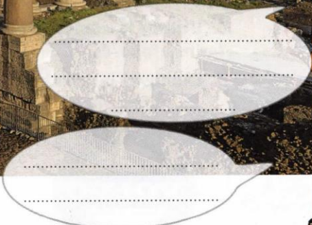
Les vestiges du Forum à Rome.

1 Reportez dans les bulles les répliques de Flora et Marcus proposées ci-dessous, puis lisez-les à haute voix en respectant les règles de prononciation (voir p. 12).