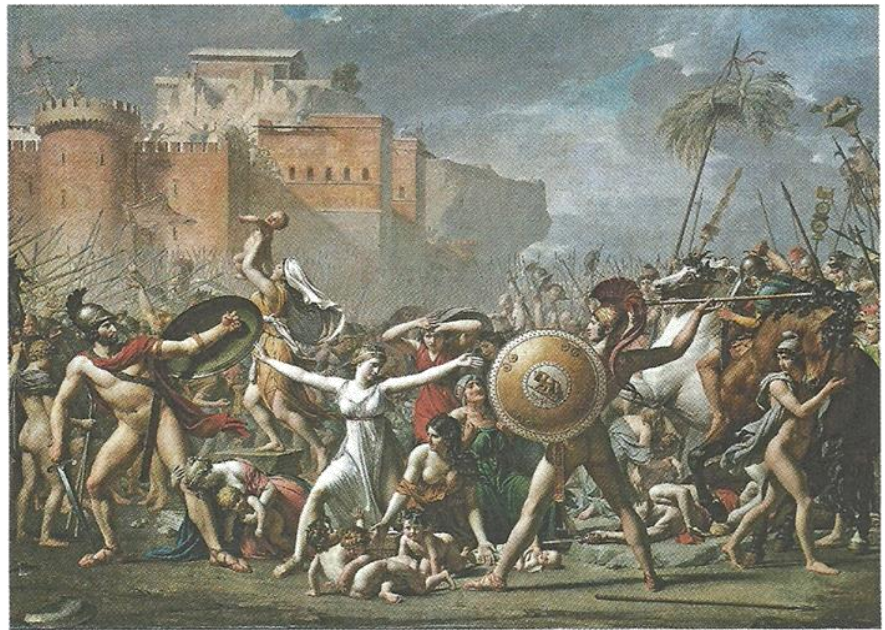
Jacques-Louis DAVID (1748-1825), Les Sabines (1799), huile sur toile, Musée du Louvre, Paris.

TITE-LIVE, Histoire romaine , I, 13. Traduction des auteurs.