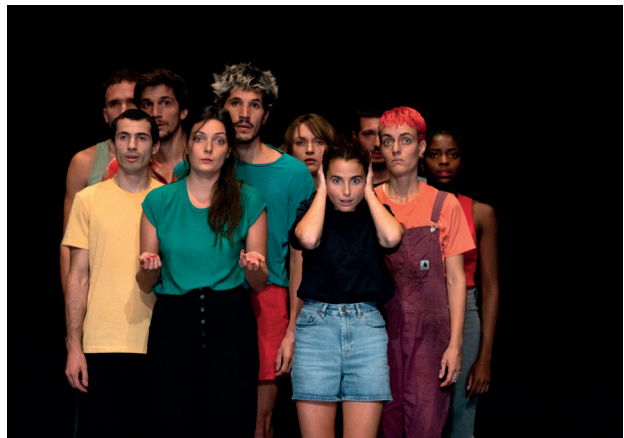
Le Chœur