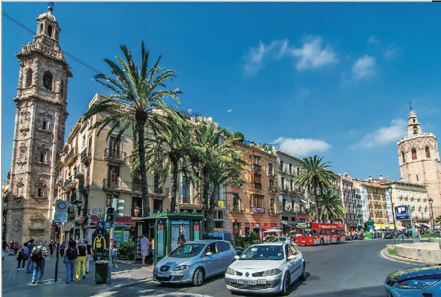
la plaza de la Reina, Valencia