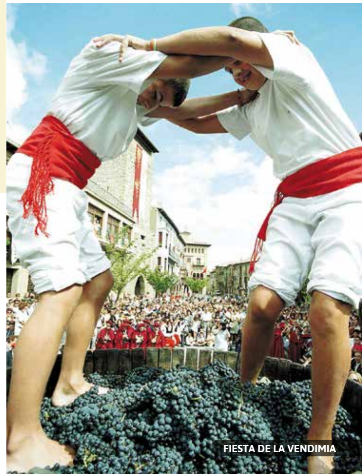
FIESTA DE LA VENDIMIA