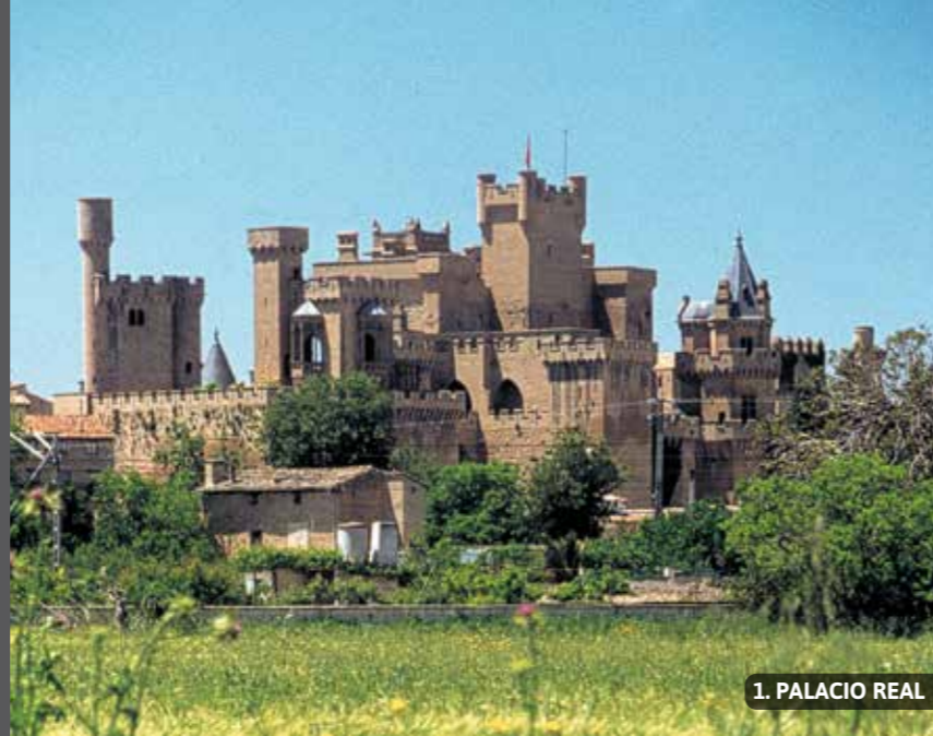
1. PALACIO REAL

Las fiestas patronales tienen lugar del 13 al 19 de septiembre.