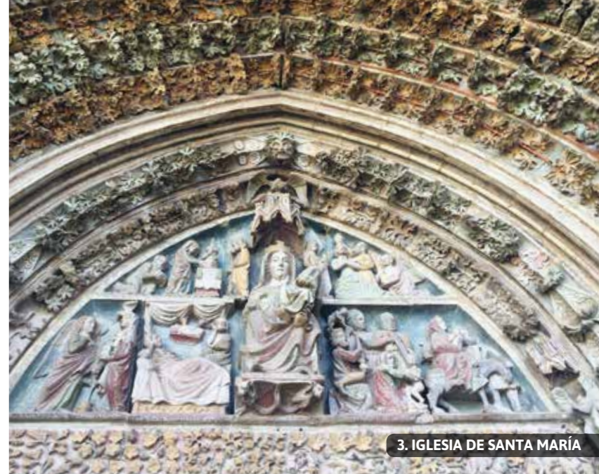
3. IGLESIA DE SANTA MARÍA