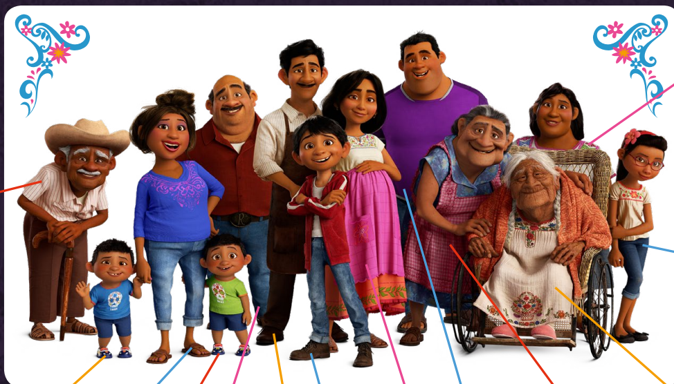
Le grand-père de Miguel, Papá Franco

La ville de Santa Cecilia est inspirée de vrais villages mexicains. Pour le Monde des vivants, les réalisateurs ont opté pour une esthétique ancrée dans la réalité ; l'atmosphère y est poussiéreuse et les couleurs relativement discrètes. Parmi les personnages principaux qui peuplent le monde des vivants figurent plusieurs générations de la famille Rivera, et toutes vivent sous le même toit.