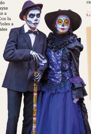
Pareja vestida y maquillada para celebrar el Día de Muertos en Oaxaca (México) →