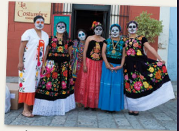
↑ Mujeres disfrazadas de La Catrina con vestidos tradicionales mexicanos.

1. prier 2. autel 3. encens 4. bougies 5. crânes en sucre