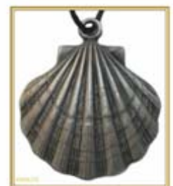
La coquille de Saint-Jacques de Compostelle