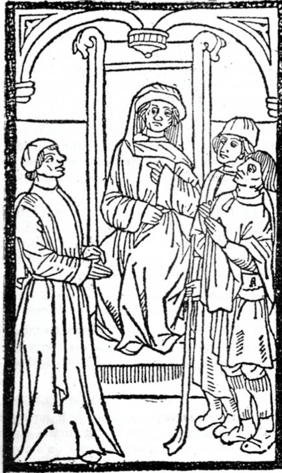
Devant le juge. Gravure sur bois pour l'édition Pierre Levet publiée à Paris en 1489.

Pour la deuxième édition de La Farce de Maître Pathelin par Pierre LEVET en 1489, le texte présente 6 gravures sur bois illustrant assez précisément les scènes de la pièce.