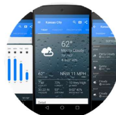
Le designer d'interface conçoit, imagine et dessine des interfaces de dialogue avec des objets.