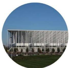
L'architecte travaille sur la forme du bâtiment afin qu'il soit esthétique.

Le design est une discipline qui permet de créer des objets techniques en tenant compte de toutes ces contraintes.