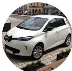
Les formes de cette voiture associent esthétique et aérodynamique.