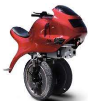
Moto électrique du futur

- La créativité relève de la réflexion. Elle permet de trouver de nouvelles idées pour inventer ou améliorer un produit ou un service.