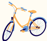
Je prends mon vélo