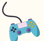
jeux vidéos console(s)