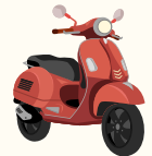
autre : .....