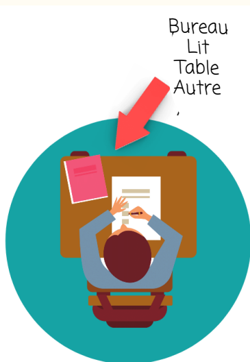
Bureau Lit Table Autre