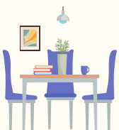
Salon / Cuisine