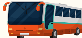
Je prends le bus