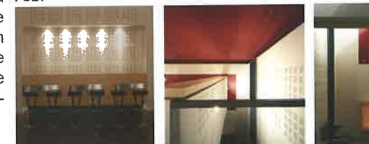
salle des professeurs

La hauteur sous voûtes de 5,40m a permis, grâce à la construction d'un plancher intermédiaire, de créer la surface complémentaire nécessaire à ce programme qui comprend un local à casiers, un foyer, une salle de travail commune, une salle de travail individuel et une salle informatique.