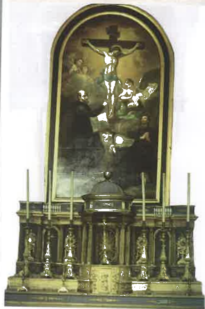
Illustrations 11 et 13