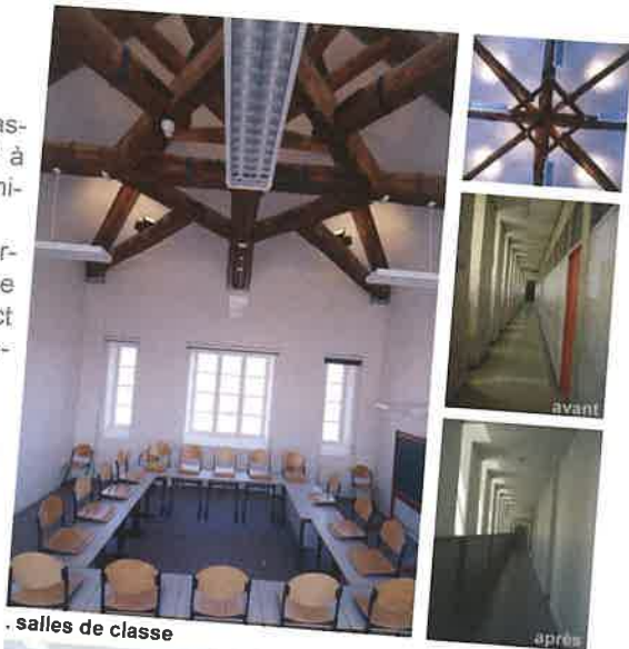
salles de classe

La restructuration globale du lycée a permis de réorganiser les départements d'enseignement de manière cohérente et de redonner une lisibilité à l'établissement.