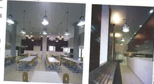
© Didier Boy de la Tour