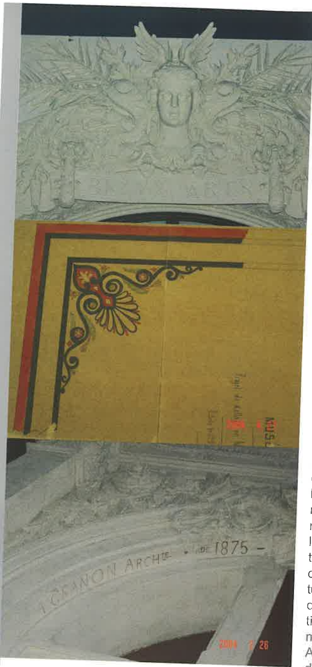
Illustrations 8,5 et 9

grande salle de peintures se reconnaît dans le décor de la salle Terrisse (porte monumentale) de vastes dimensions (35 x 15 m et 8 m de haut) : la galerie Gower constituée de quatre salles en façade de 150 m 2 chacune, dont l'une constitue l'actuel vestibule, l'arcature du fond portant la signature de Granon (ill.9). On reconnaît les stucs des plafonds, les mosaïques, les colonnes, l'ornementation des portes. L'extérieur des nouvelles constructions peut s'observer dans la cour des " prépa " l'imposante façade aveugle devait constituer une future entrée monumentale du Musée de peinture, symbolisé par ce remarquable dessin architectural inspiré de la Grèce antique (ill.14,15). Un jardin public aurait dû l'entourer.