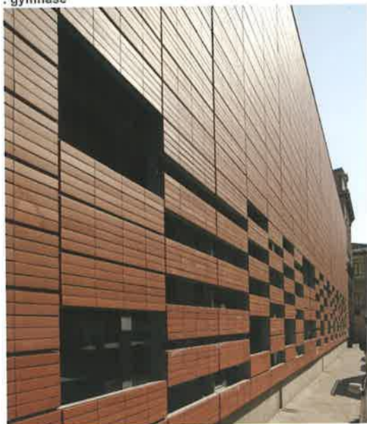
© Didier Boy de la Tour

La façade sur rue en éléments de briques sur cadres métalliques fait la jonction entre deux corps de bâtiment du XIX ème S, par un effet d'abstraction et de porosité qui ne rentre pas en concurrence avec l'existant.