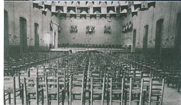
Illustrations 14, 15 et 10