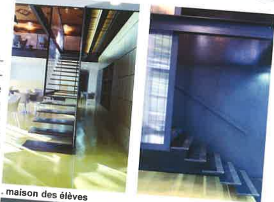
maison des élèves

La maison des lycéens a été aménagée dans un volume unique d'environ 100 m 2 au sol et de 5,4m de hauteur sous-voutains. Profitant de cette très grande hauteur sous plafond, deux mezzanines formant des espaces plus intimes s'installent de part et d'autre d'un espace central toute hauteur.