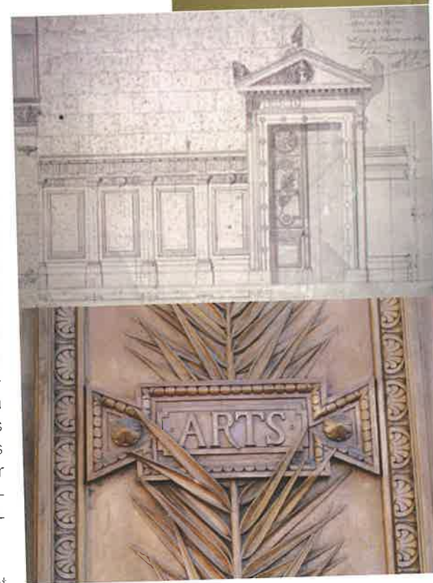
Illustrations 4, 6 et 7