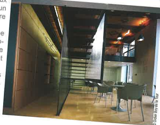
© Didier Boy de la Tour

Concernant les ouvertures ceintrées de la façade côté cour, les châssis vitrés toute hauteur ont été réalisés afin d'assurer un meilleur confort lumineux intérieur.