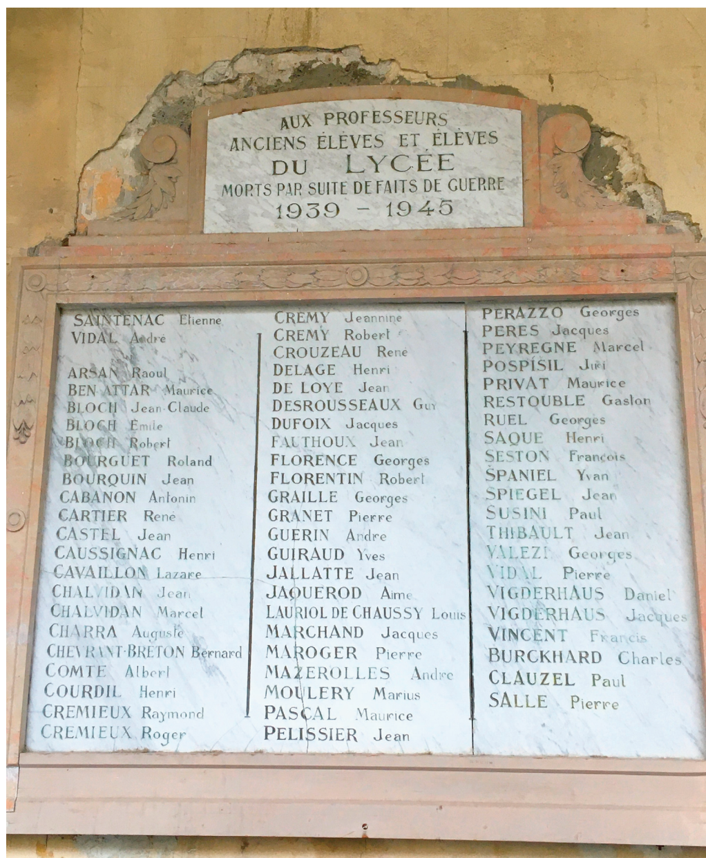
Fig. 1 - Plaque commémorative de la Seconde Guerre mondiale Cour d'honneur du lycée Alphonse Daudet, Nîmes