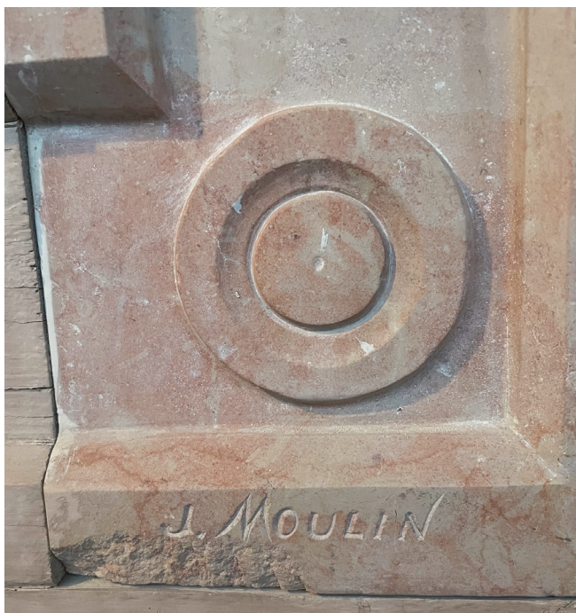
Fig. 2 - Plaque commémorative de la Seconde Guerre mondiale, détail en bas à droite. Cour d'honneur du lycée Alphonse Daudet, Nîmes