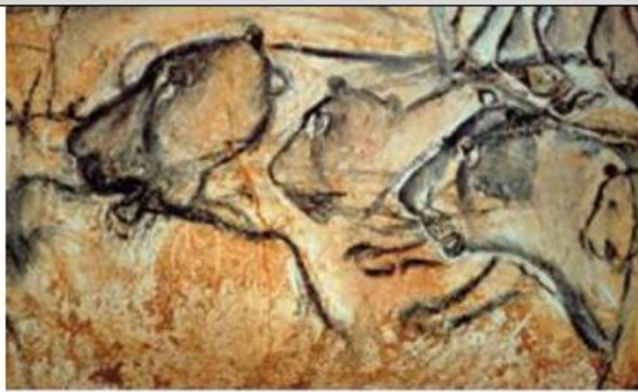
Les lions de la grotte Chauvet