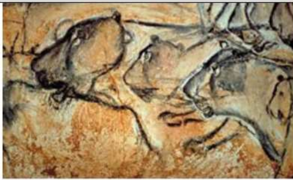
Les lions de la grotte Chauvet