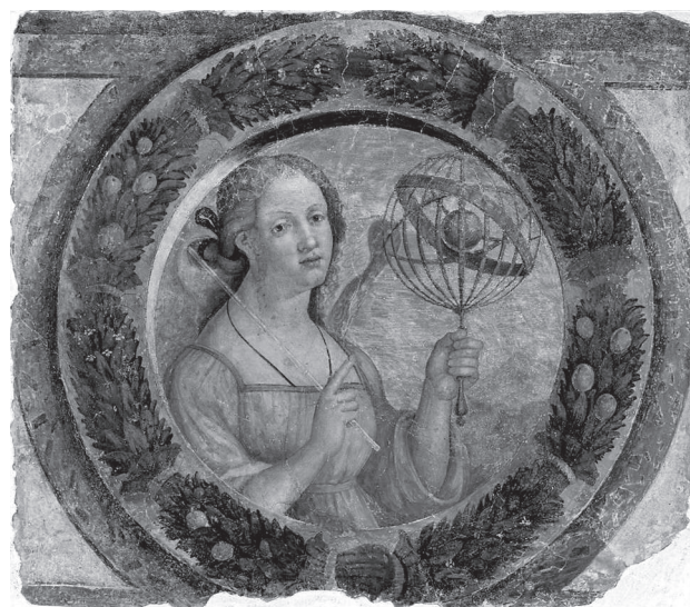
Nicola Giolfino Allegoria dell'Astronomia