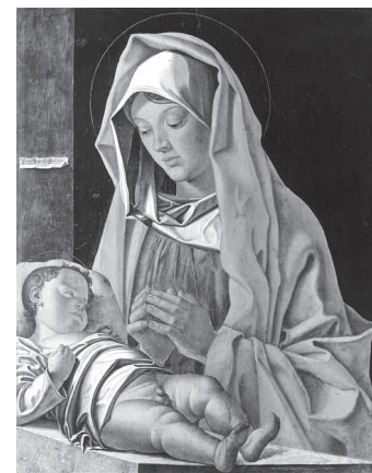
Francesco Bonsignori Madonna con il bambino

LA STANZA è dedicata soprattutto dalle opere di Francesco Bonsignori, robusto pittore veronese passato presto, già verso la fine degli anni ottanta del Quattrocento, alla corte di Mantova a fianco di Andrea Mantegna, dove fu impegnato soprattutto come ritrattista e pittore di soggetti storici.