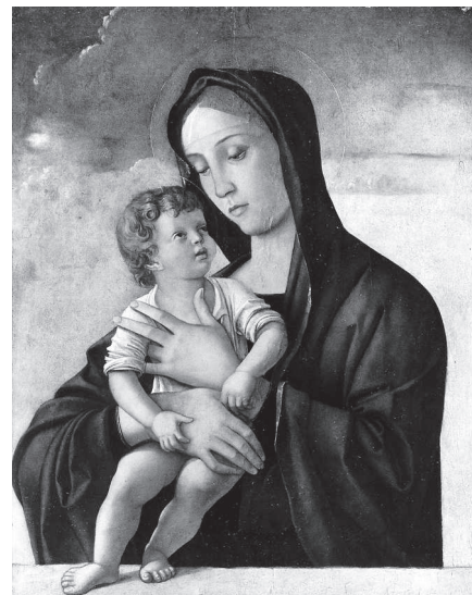
Giovanni Bellini Madonna con il bambino

NELLA SALA sono esposti dipinti della seconda metà del Quattrocento di scuola veneta, e veneziana in particolare.