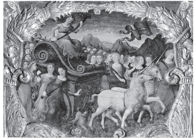
Liberale da Verona Trionfo della Castità

LA STANZA è destinata principalmente alle opere di Liberale da Verona. Il pittore si dedicò in prevalenza nella prima parte della sua vita alla miniatura, creando nel genere alcuni tra i massimi capolavori del Quattrocento italiano, come i corali della cattedrale di Siena. Ritornato stabilmente in patria negli anni ottanta, si dedicò soprattutto alla pittura ad affresco e su tavola, spegnendo tuttavia progressivamente la splendida vena creativa giovanile.