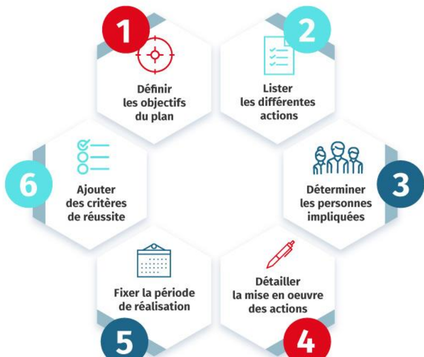
Fig 22 : "Tableau de Bord" de la planification stratégique du groupe "Quéops"