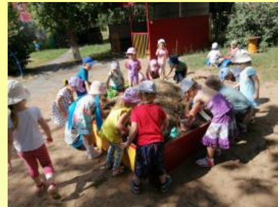
ЛЕТО – МАЛЕНЬКАЯ ЖИЗНЬ