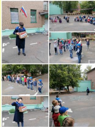
ДЕНЬ ГОРОДА «ОРСКУ 288»