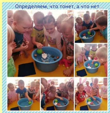
ОПЫТЫ С ВОДОЙ