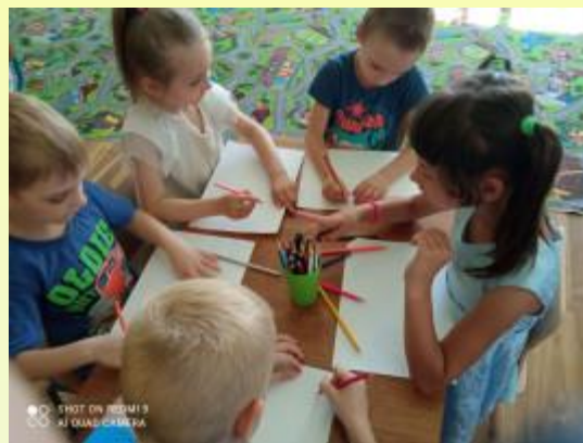
МЫ РИСУЕМ ЛЕТО