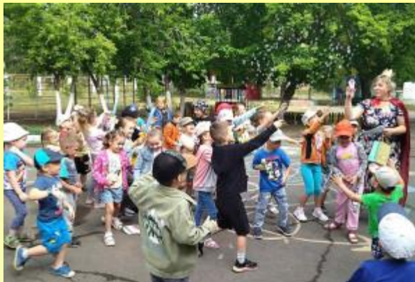
ПРАЗДНИК МЫЛЬНЫХ ПУЗЫРЕЙ