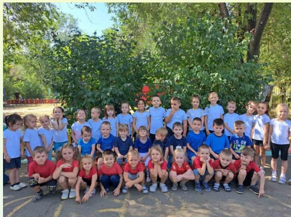
ДЕНЬ РОССИЙСКОГО ФЛАГА