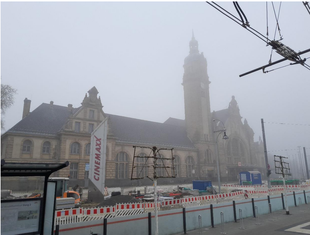
Das sonnige Krefeld...