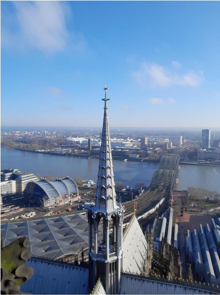
Köln – Blick vom Dom und Zentralmoschee