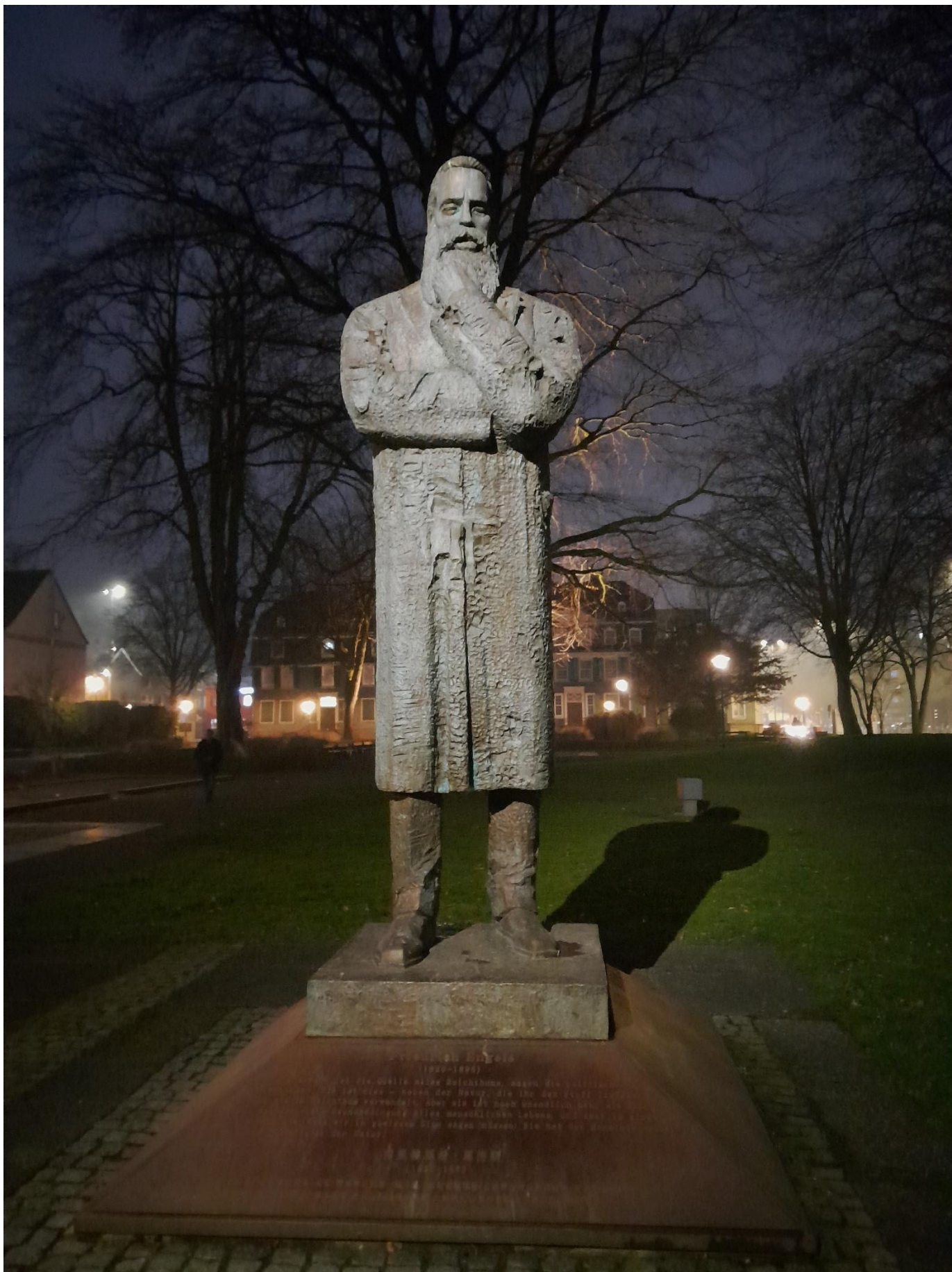
Friedrich Engels, dahinter das Haus der Familie Engels in Wuppertal