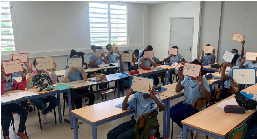
Une activité de calcul mental sur la soustraction de nombres relatifs.

l'apprentissage par la répétition: effet sur la mémorisation, l'automatisation, l'autoévaluation. 4- Le retour au cahier pour la trace se fait plus volontiers une fois la notion mieux maîtrisée. C'est plus encourageant et pertinent de passer à l'écrit sur un cahier quand on commence à maîtriser une notion que lorsque l'on doit affronter la page blanche sans maîtrise.