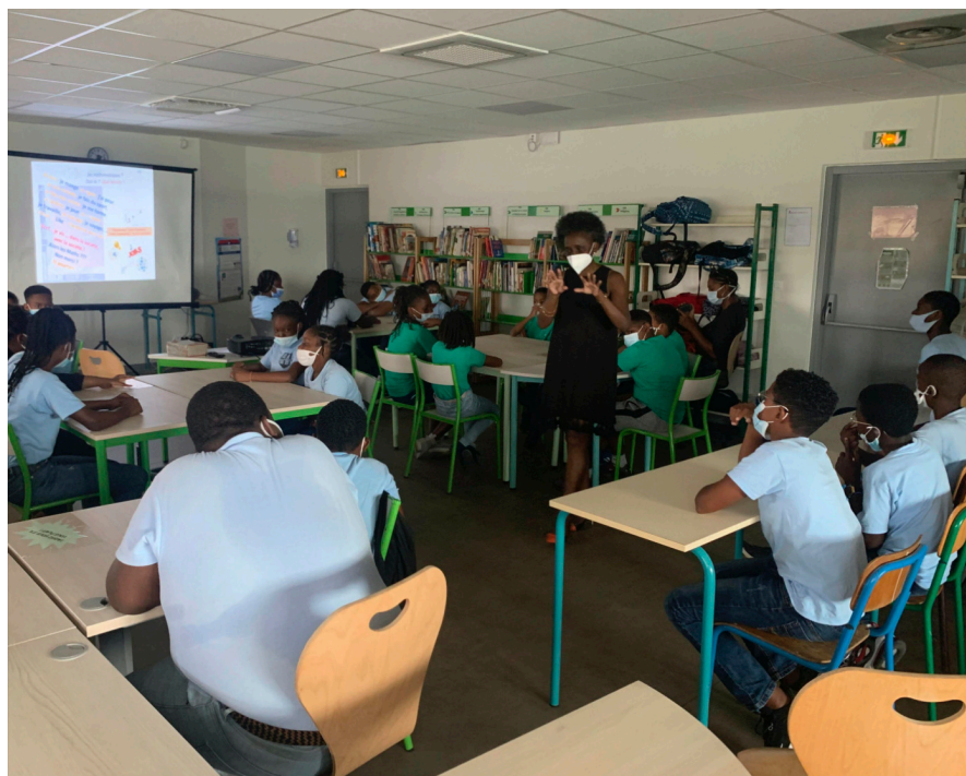
Regroupement entre élèves de 6èmes et de cm2 dans le cadre de la semaine des Mathématiques

Rem aperiam, eaque ipsa quae ab illo inventore veritatis et quasi architecto beatae vitae dicta sunt explicabo. Nemo enim ipsam voluptatem quia voluptas sit aspernatur aut odit svitae dicta sunt explicabo. Nemo enim ipsam voluptatem quia voluptas sit aspernatur aut odit squam ese omnis