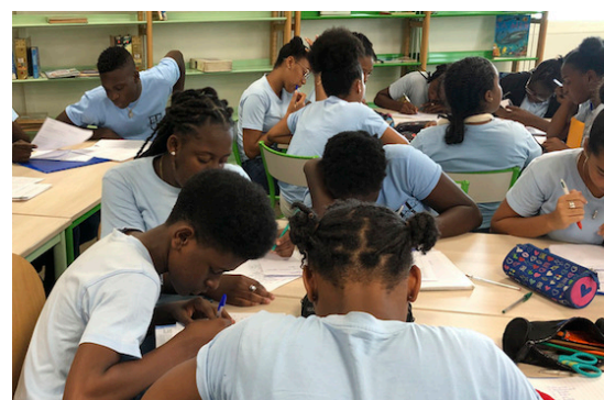
Des élèves de 4èmes au travail, sur un espace en îlot pour faciliter les échanges après un travail individuel.

La différenciation est la prise en compte par les acteurs du système éducatif des caractéristiques individuelles (besoins, intérêts et motivations ; acquis, non acquis et difficultés ; modes d'apprentissage (style, rythme, pouvoir de concentration, engagement... ; potentialités à exploiter...) de chaque élève en vue de permettre à chacun d'eux de maîtriser les objectifs fondamentaux prescrits et de développer au mieux leurs potentialités, et de permettre au système éducatif d'être à la fois plus pertinent, efficace et équitable. W.Diaz (Clg Kermadec)