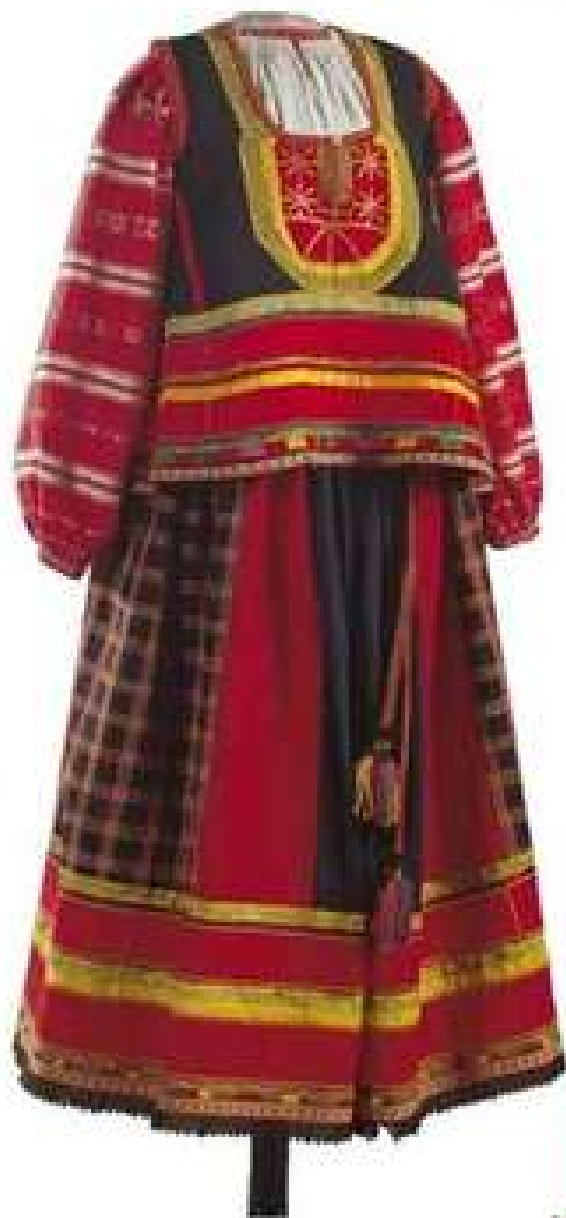
РУБАХА, ПОНЕВА, НАВЕРШНИК