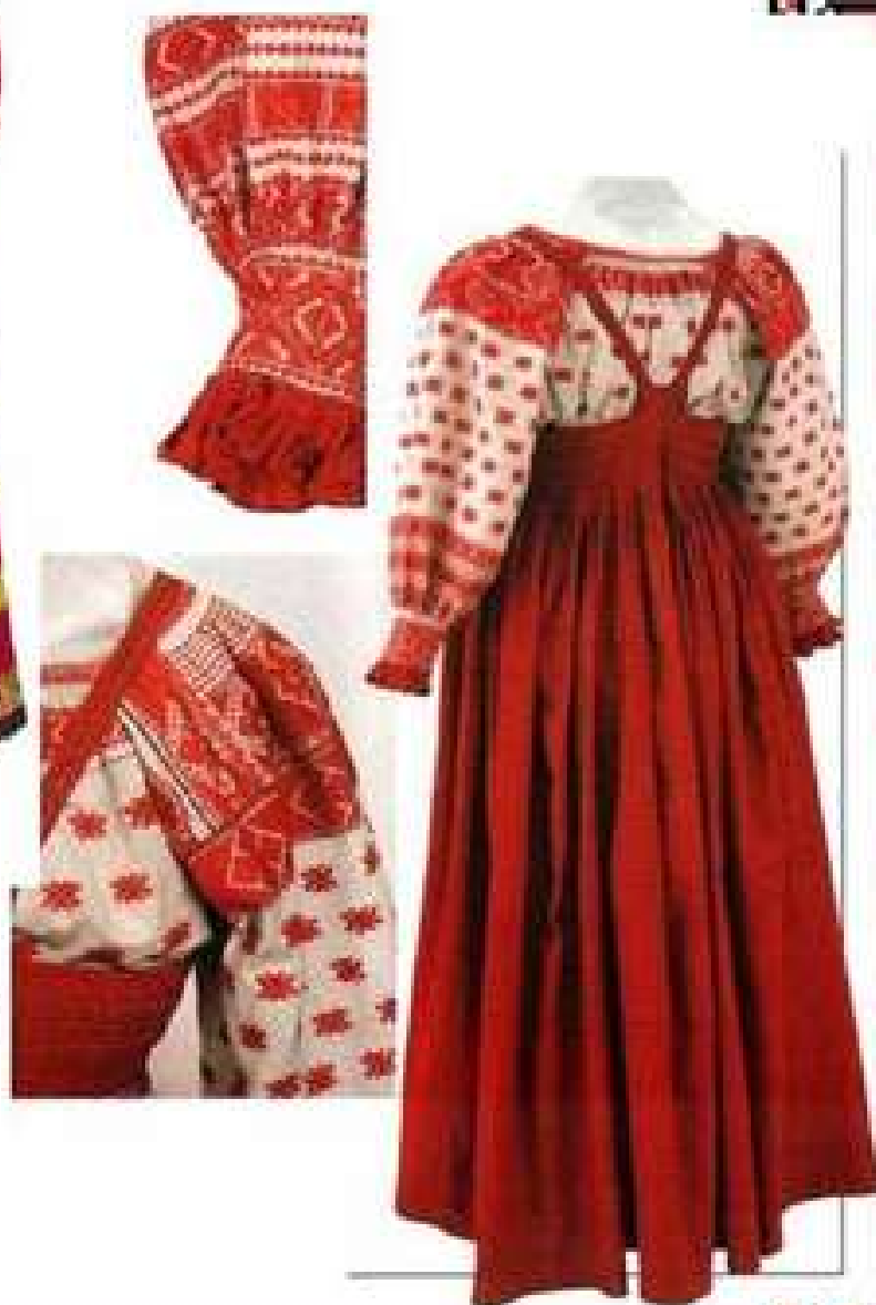
РУБАХА И САРАФАН