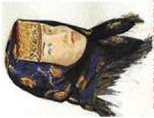
ПОВЯЗКА С ПЛАТКОМ