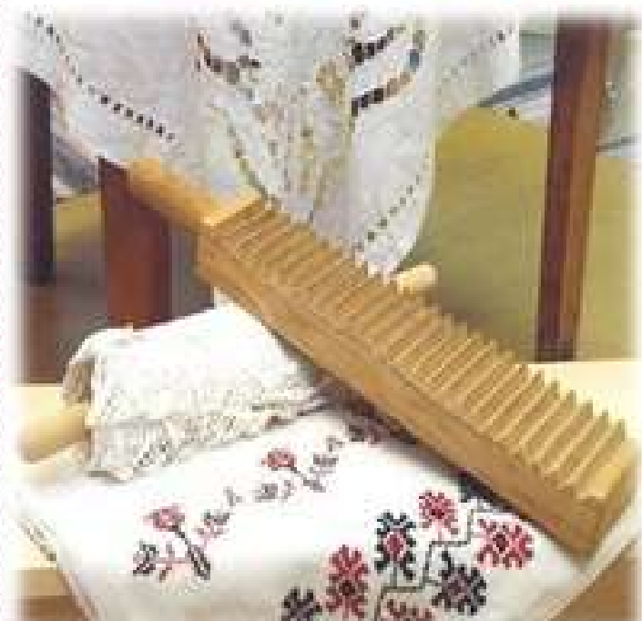
РУБЛЬ И ВАЛЕК

На Руси были своеобразные приспособления для стирки, глажки и хранения белья.