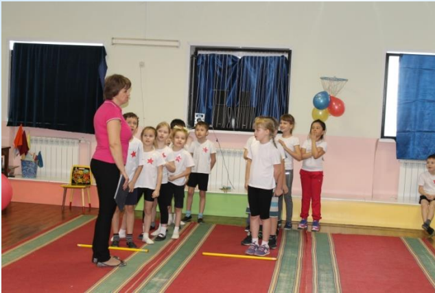
Эстафета «Меткий стрелок»