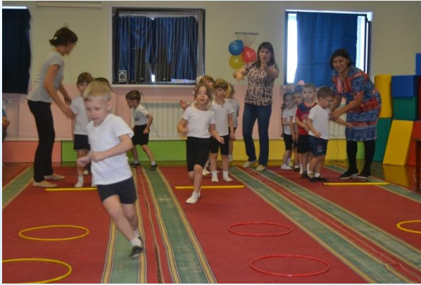
Эстафета «Минное поле»