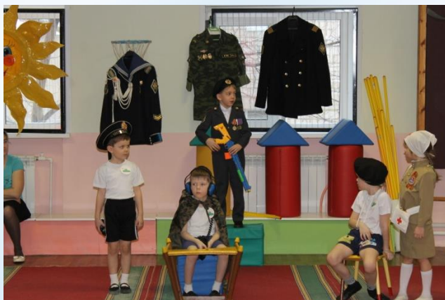
Инсценировка по стихотворению «Трудный бой»

Цель: Воспитание уважения к историческому прошлому своего. Развитие патриотизма, воспитание чувства гордости за свою страну и родной край, уважения к славной истории Отечества. Способствовать формированию представлений о профессии «военнослужащего».