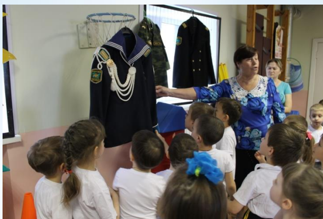
Знакомство с формой разных родов войск