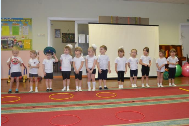
Дети читают стихи. Профессии пап.