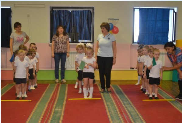
Эстафета «Передай знамя»