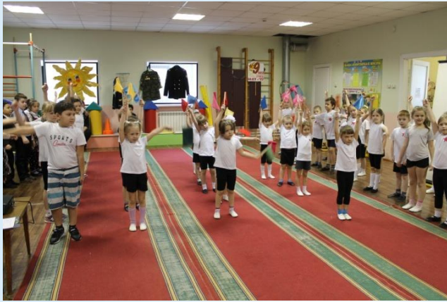
Утро в армии начинается с зарядки