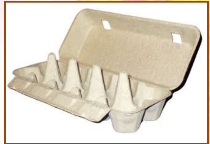
Ячейки для сбора коллекции