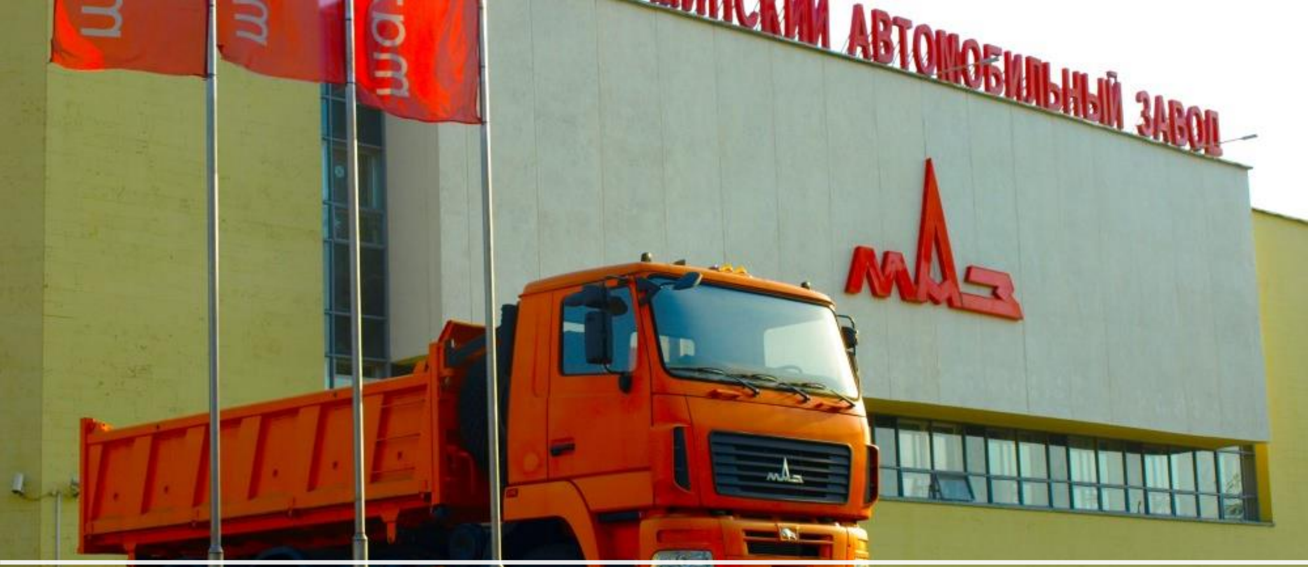
Минский автомобильный завод