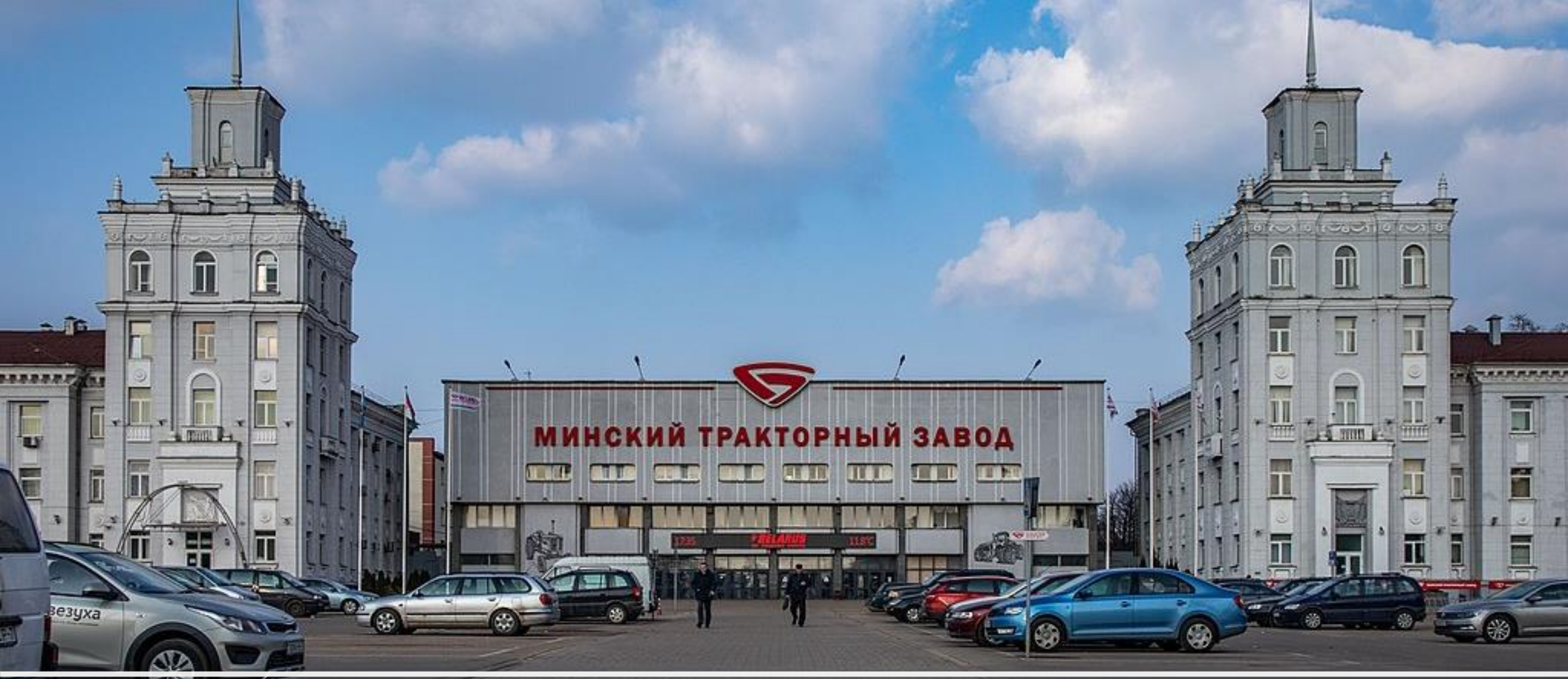
Минский тракторный завод