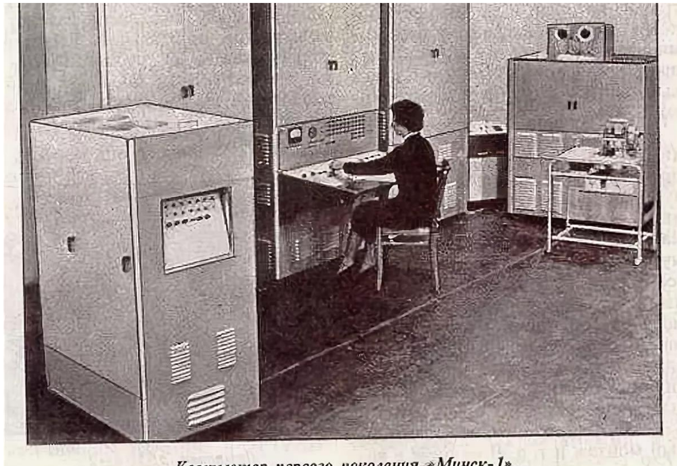
Компьютер первого поколения «Минск-1»