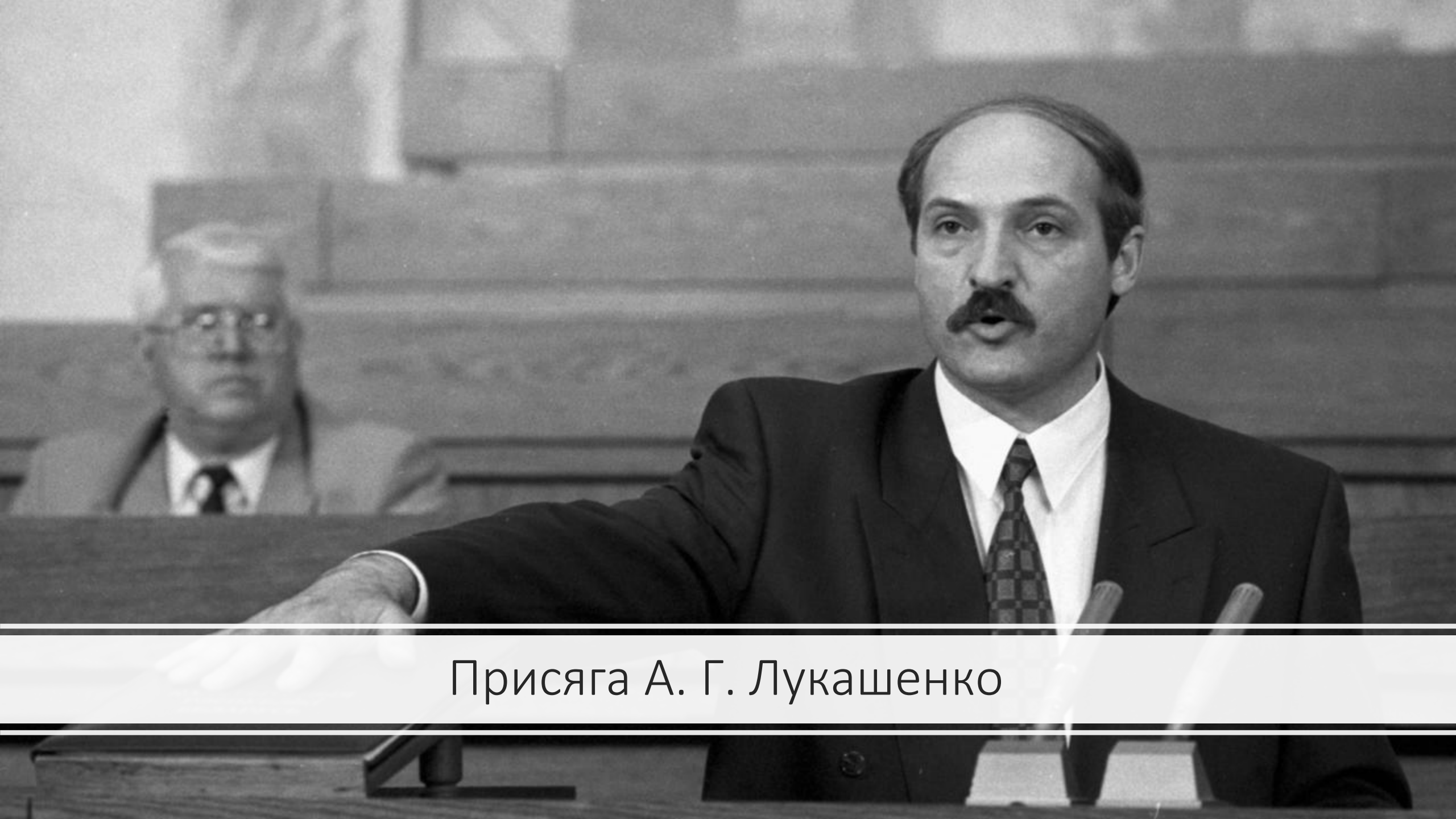
Присяга А. Г. Лукашенко