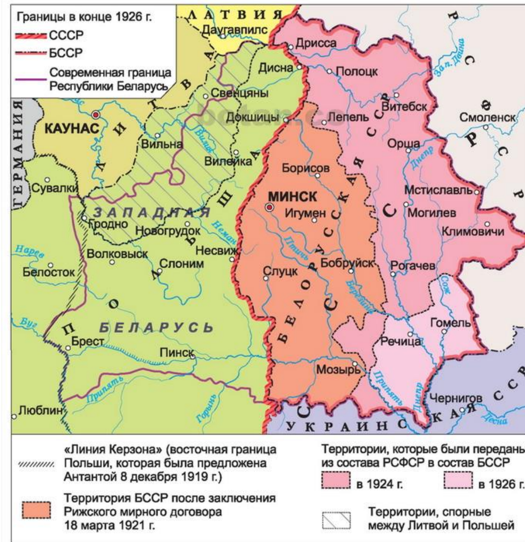
Территория Беларуси после заключения Рижского мирного договора. Укрупнение БССР в 1924 и 1926 гг.