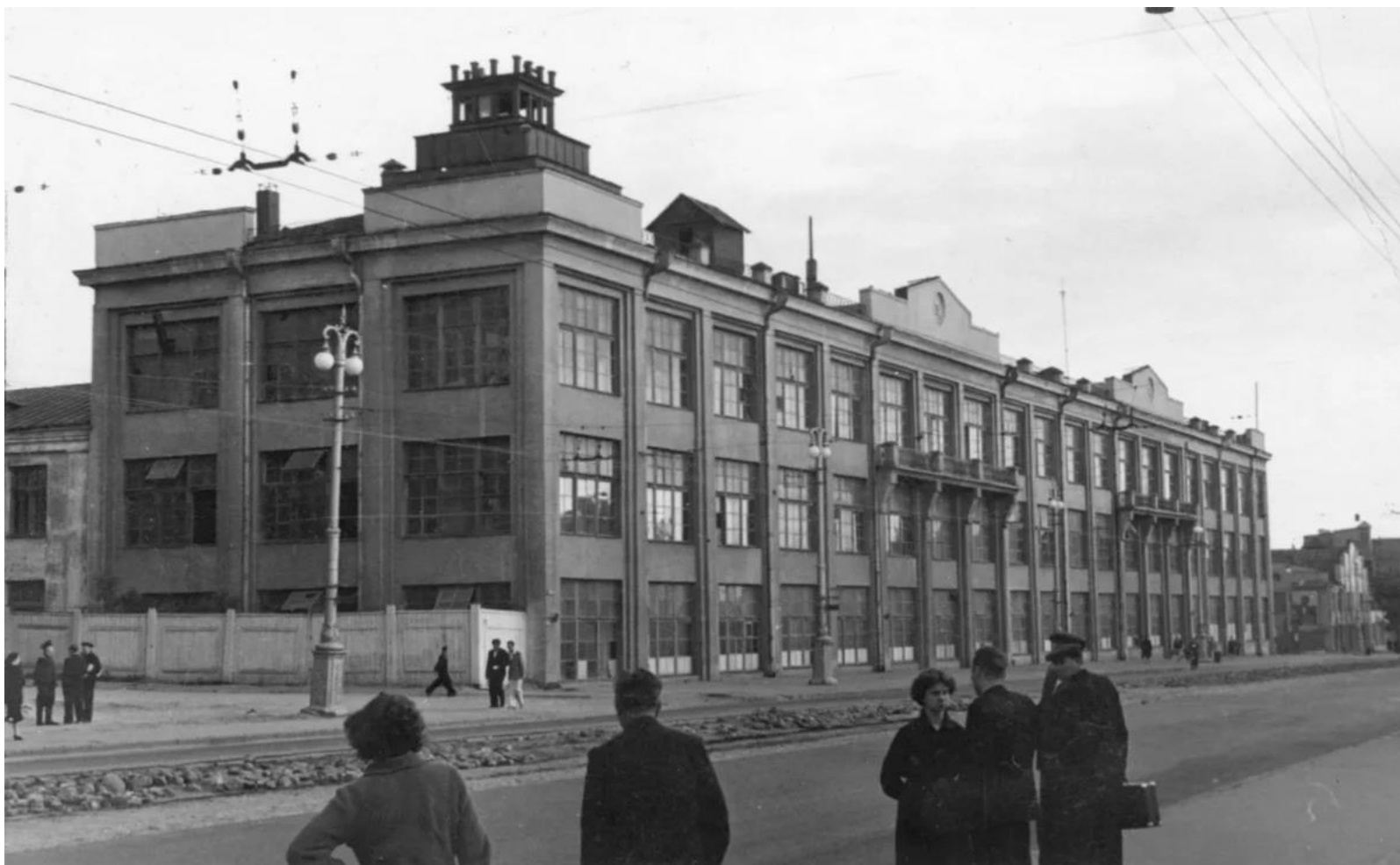
Минский радиозавод (Горизонт)