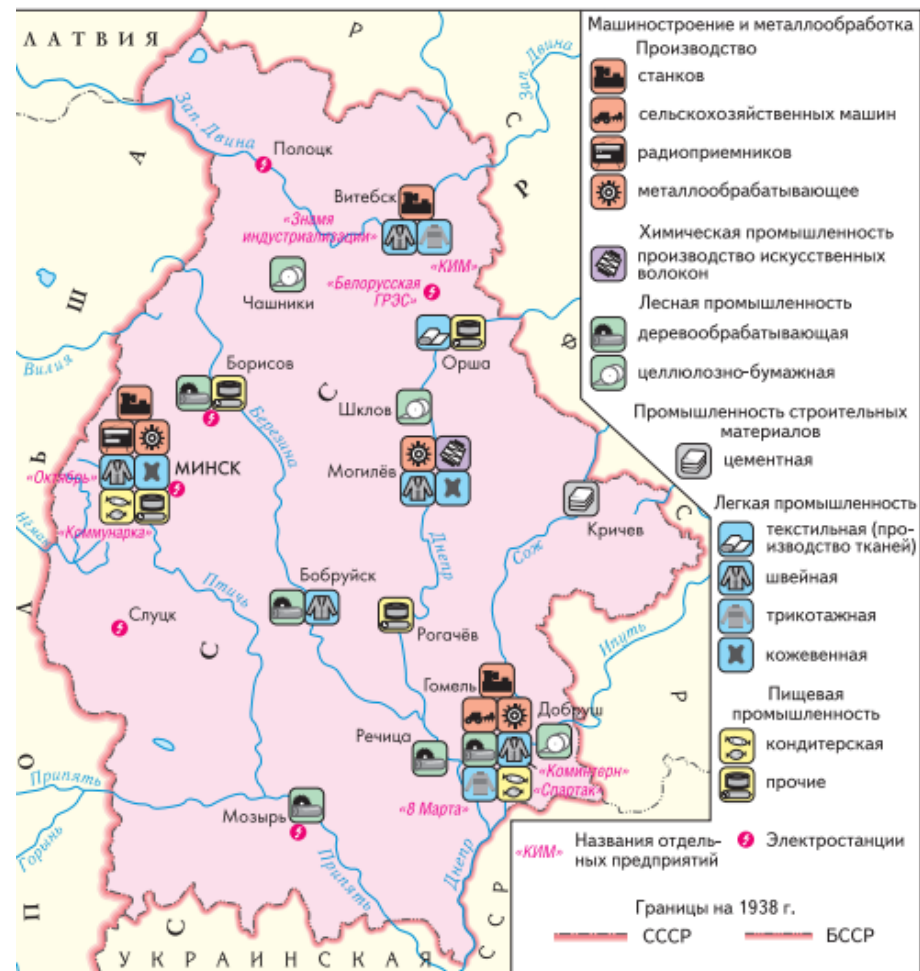
Индустриализация в БССР в годы первых пятилеток