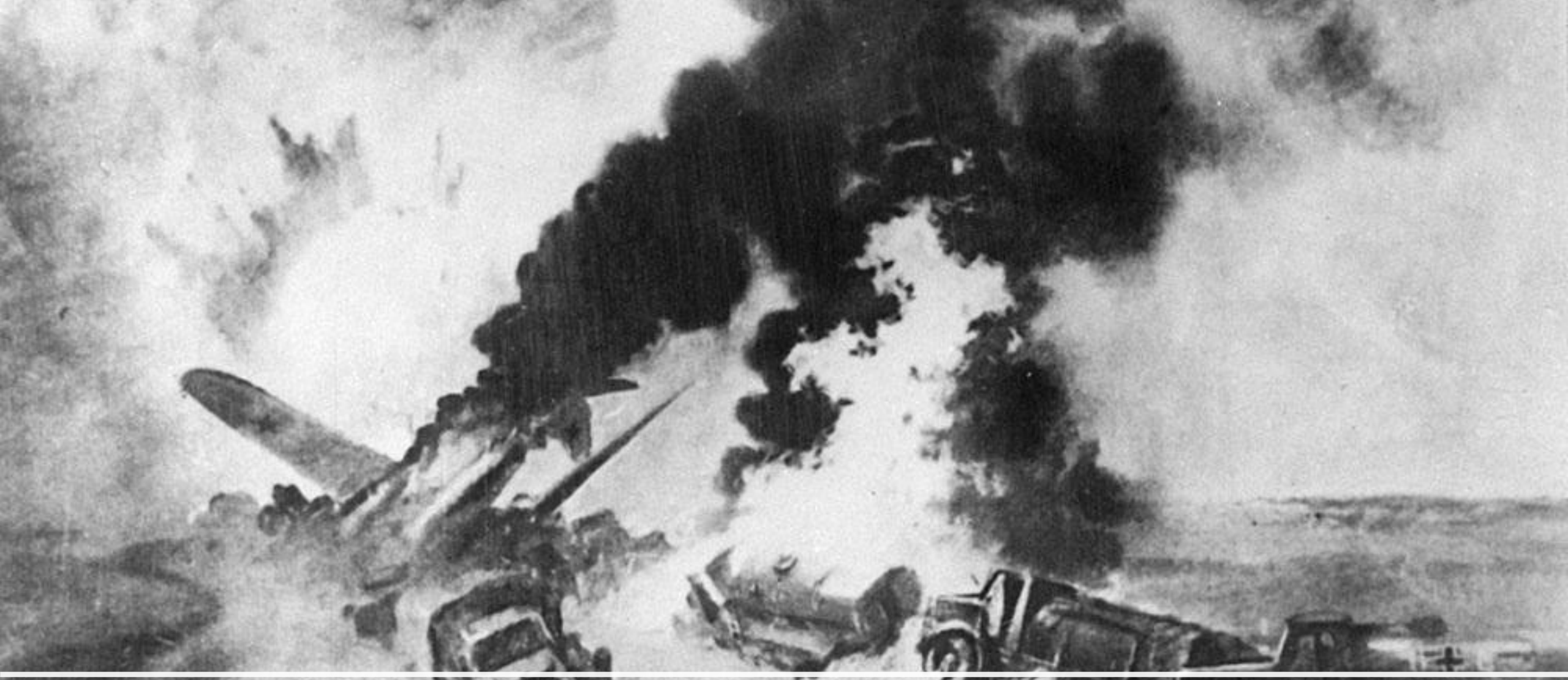
Подвиг экипажа Н. Гастелло