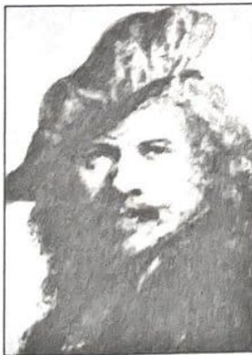
Харменс ван Рейн Рембрандт

8. Рассмотрите автопортреты великих художников. Что в облике человека того времени удалось передать авторам? Свое мнение поясните.