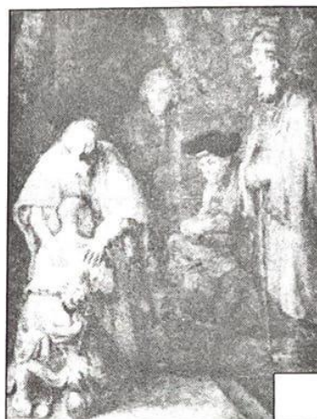
Возвращение блудного сына

4. Перечислите знаменитые произведения писателей-просветителей.