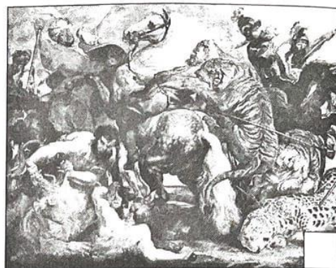
Охота на тигров и львов