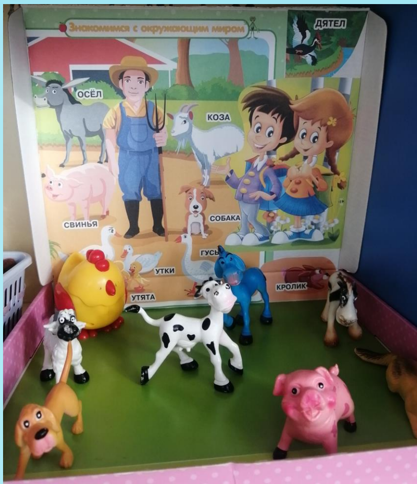
Макет "Домашние животные"