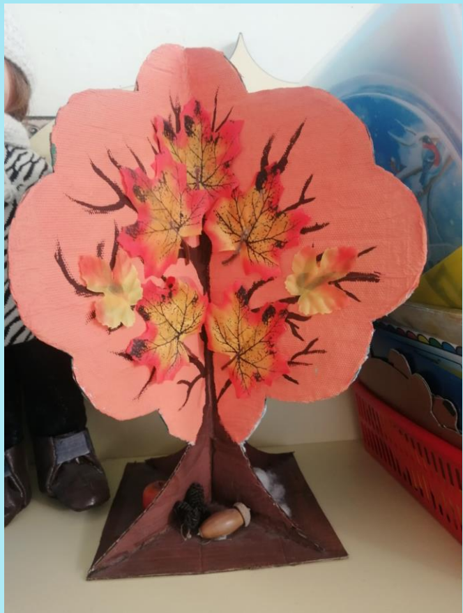
Макет "Сезонное дерево"