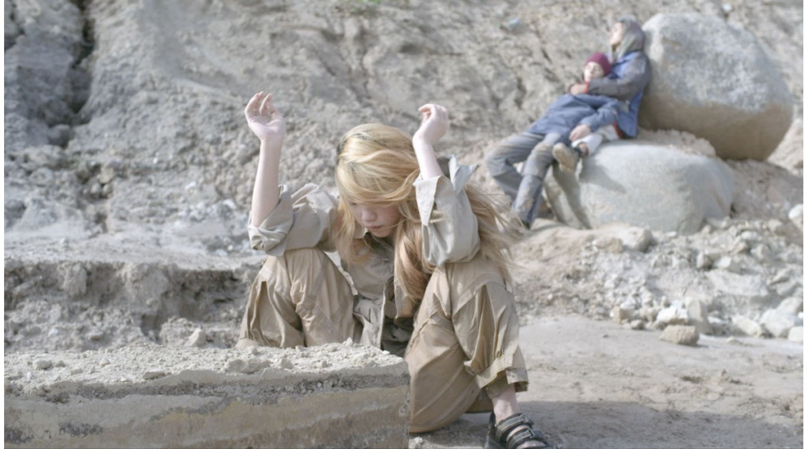
Eglė Budvytytė, De sang chaud et de terre (Warm Blooded and Earthbound) , 2024 © Eglė Budvytytė